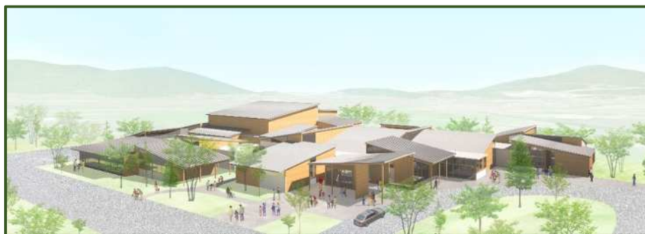
新中央公民館鳥瞰図