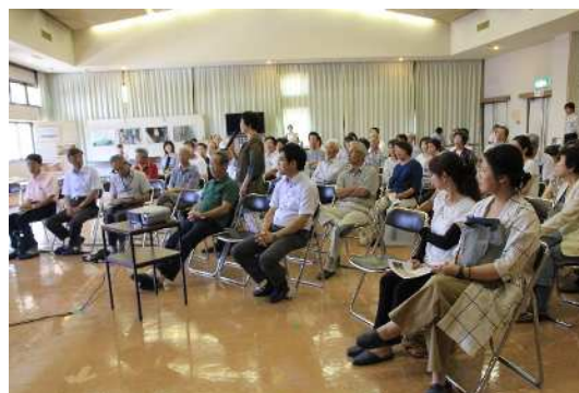
【新公民館町民説明会の様子】