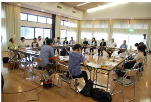
【語ろう会の会議の様子】