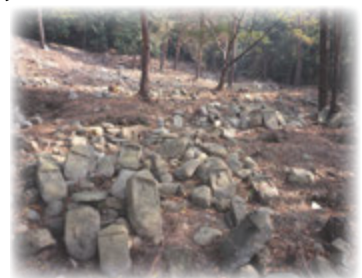
史跡敏満寺石仏谷墓跡

※敏満寺石仏谷墓跡は、胡宮神社から約200mほどの距離ですが、一部に傾斜の急な道があります。動きやすい服装でお越しください。