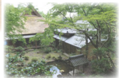
名勝胡宮神社社務所庭園