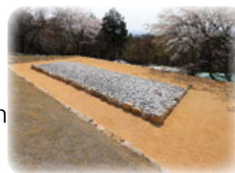
復元整備された中世墓