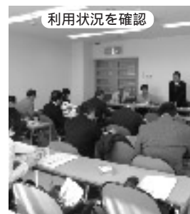
美里文化センター 文化ホール