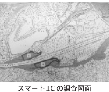
スマートICの調査図面

問 史跡との問題は。 答 この史跡は貴重なものであり、現在、町・県・国(文化庁)の3者で協議を重ねている。名神拡張工事の際にも調査があった。未調査の部分を含め今回調査し、協議に活かしたい。