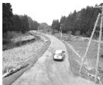
県道水谷彦根線バイパス

問 大滝小学校前の歩道整備箇所に、車の減速帯など安全対策は。 答 要望があれば県に上げる。 問 大滝小学校前の歩道整備箇所に、車の減速帯など安全対策は。 答 要望があれば県に上げる。