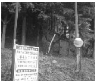
尼子急傾斜対策工事