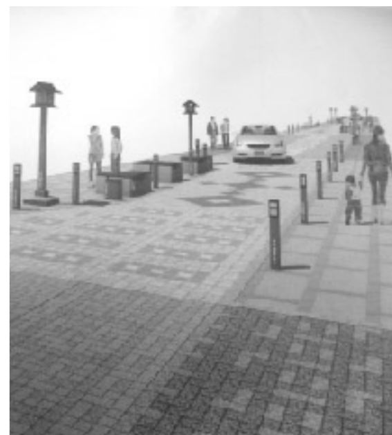
絵馬通りの活性化を(イメージ図)

町長 昨年、芹谷地域11集落の参加をいただき実施した。集落間連携については、集落間の応援協定をすすんでいる。大変残念に思っている。行政として解散を止める事はできないが、老人会からの要望にこたえたい。 町長 絵馬通りは、今日まで各地区で防災訓練をされているが、集落間の連携について考えているか。最近、大きな集落の老人会が解散されたと聞いた。地域福祉で一番大切な部分であり、支援が必要ではないのか。