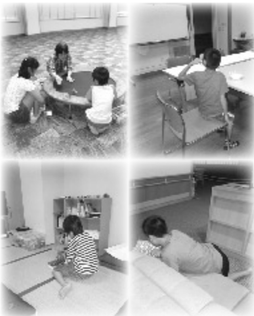
障がい児放課後児童クラブ

今年度から障がい児放課後児童クラブが開設された。子ども子育て支援法もスタートし、子育ての充実が町長の重要施策の一つである。町長の熱い思いに保護者も期待していた。 しかしながら放課後児童クラブ同様、平日利用できると思われていたが、水曜、金曜の週2日、長期休暇についても週2日、特別支援学級の子どもについては、保護者が学校に迎えに行き送っていないと利用できないのが現状である。 今後の進め方は、放課後児童クラブと同様の開設は、学校の通学バスが利用できるよう教育委員会と協議する。 当初6人の利用申請が現在では9人の利用申請がある。希望者が増えることからスタッフの確保の問題もあり、調整の上、順次開設日数の増加に努める。 特別支援学級の子どもの対応は、委託先の杉の子会とも十分協議を重ね、保護者の皆さんの意見も聞きながらより良い運営に尽くしたい。