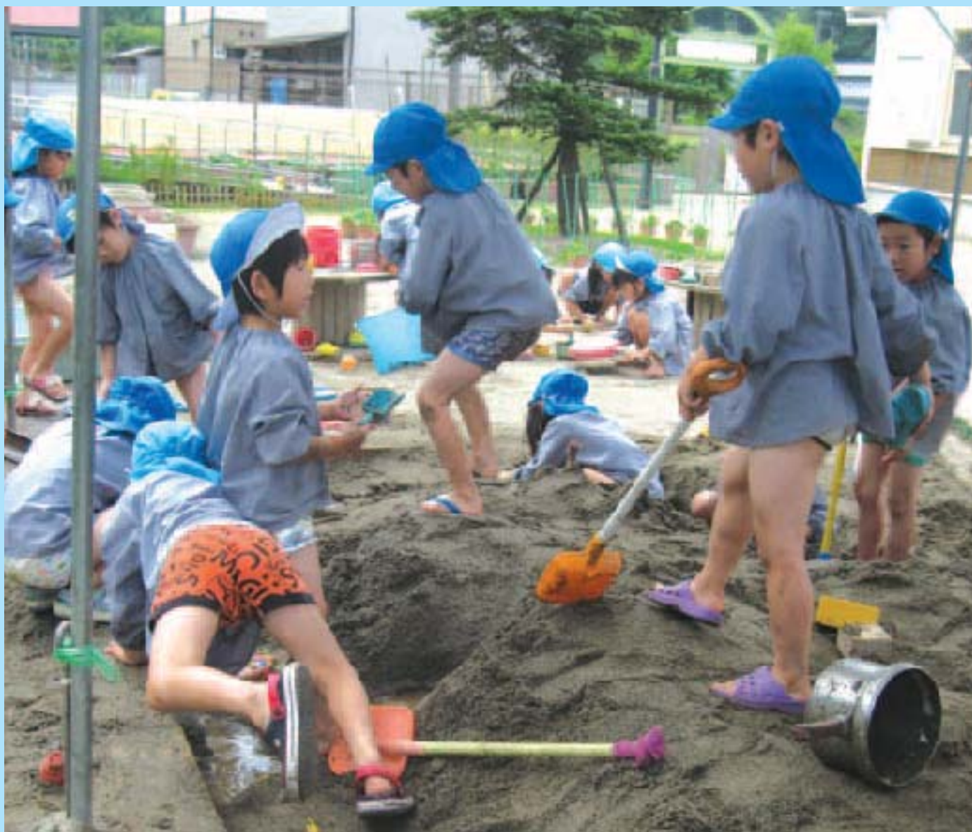
夏だ！ みんなで元気に砂あそび（ささゆり保育園）