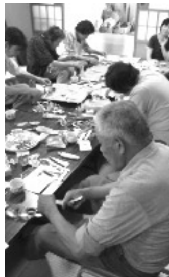
高齢者サロンで七夕かざり