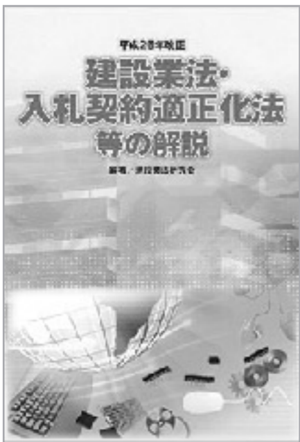
入札・契約の適正化を