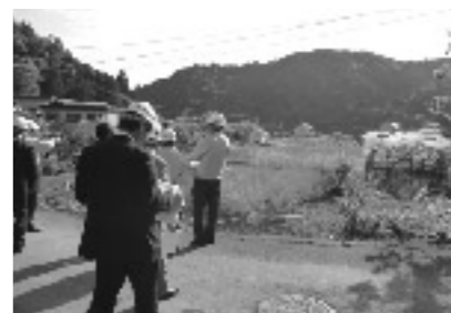
町道 二本木西ノ脇線