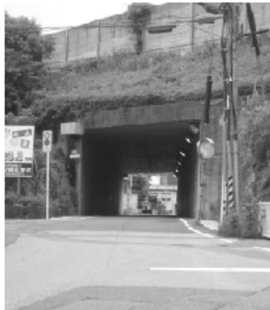
四ツ谷トンネルの安全策を

町内の集落間道路に防犯灯が少なく、夜間通行時に危険である。通学路の安全・安心のためにも防犯灯が必要である。 総務課長 県道、国道に防犯灯の設置の必要性を感じている。安価で数多くの設置を考えたい。 質問2 四ツ谷トンネルの安全性を 産業環境課長 昨年度の捕獲頭数はサル20頭、シカ816頭、イノシシ81頭で、現在も捕獲を進めている。また、サルの群れの分布調査や集落環境点検を行っている。対策事業として、個人の家庭菜園を中心に補助もしている。今後、各集落での効果的な獣害対策について協議して行きたいと考えている。