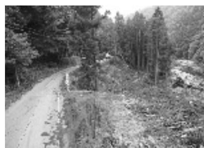
道路整備(河内下村地先)

問 地域振興事業はすべて27年度内に完了するのか。 答 国の道路予算が見込みより少なく、完了は難しい。