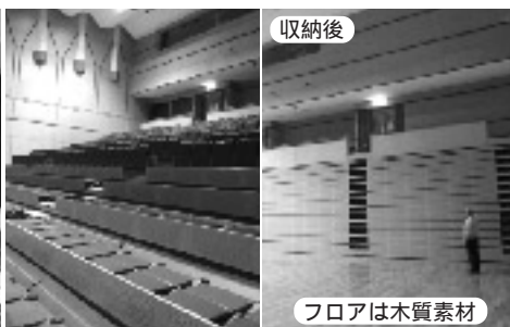
フロアは木質素材