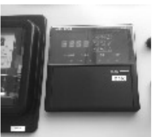
あけぼのパーク修繕