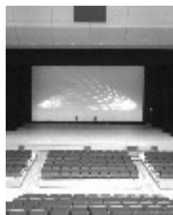
津市芸濃総合文化センター 市民ホール