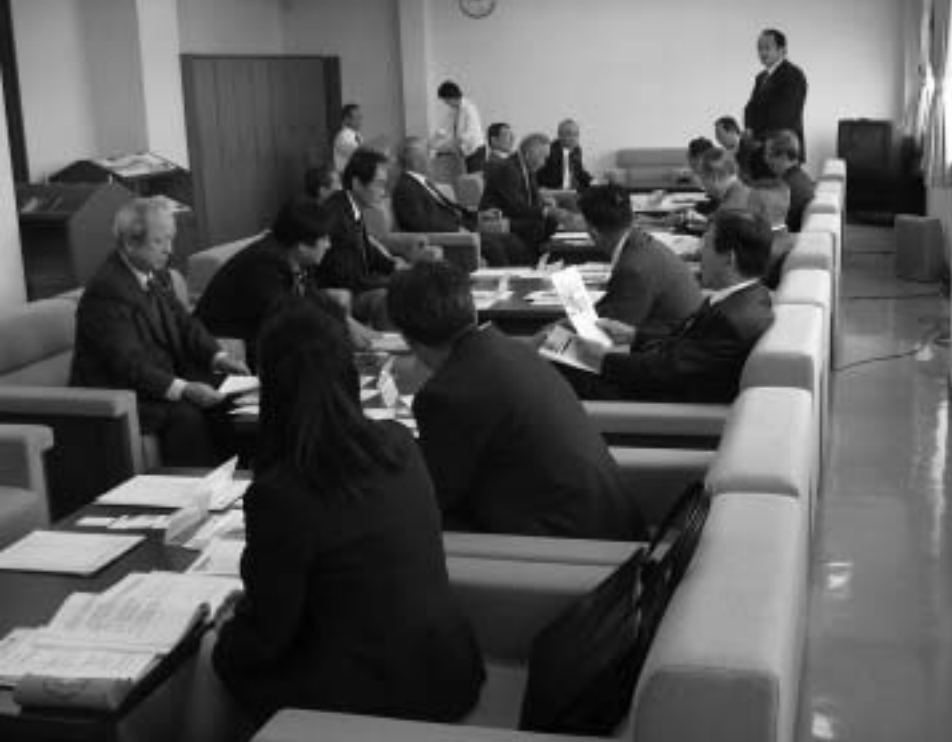
佐用町庁舎にて研修