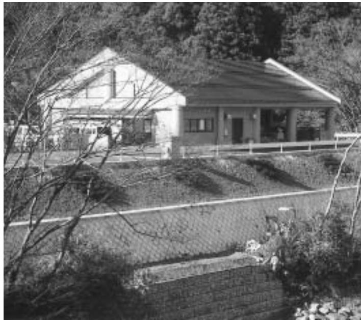
完成まじかの佐目地区下水道処理施設

老人保健事業特別会計 216万円を追加。介護保険事業特別会計 2399万円を追加。水道事業会計 272万円を追加。