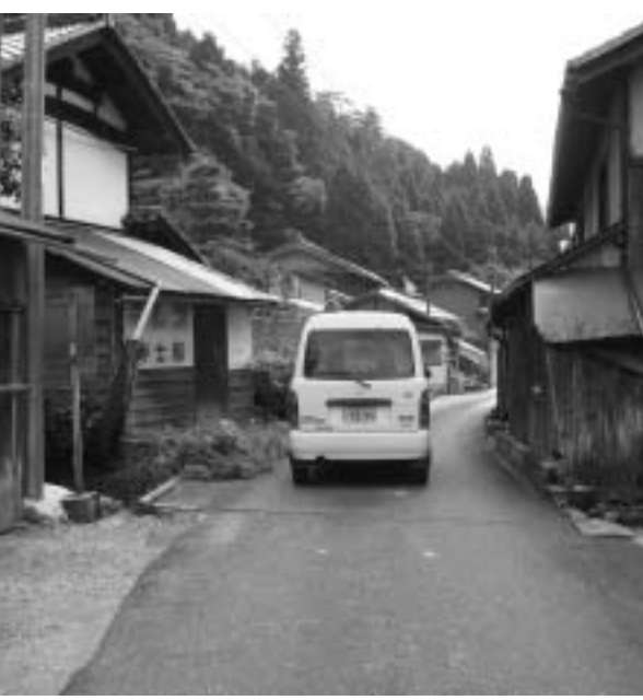
軽四が対向できない県道

多賀町として今後、いかなる考えをもち対処していくつもりか、町長の考えを聞く。 水谷の皆さんと全く変わらない気持ちで知事と交渉している。