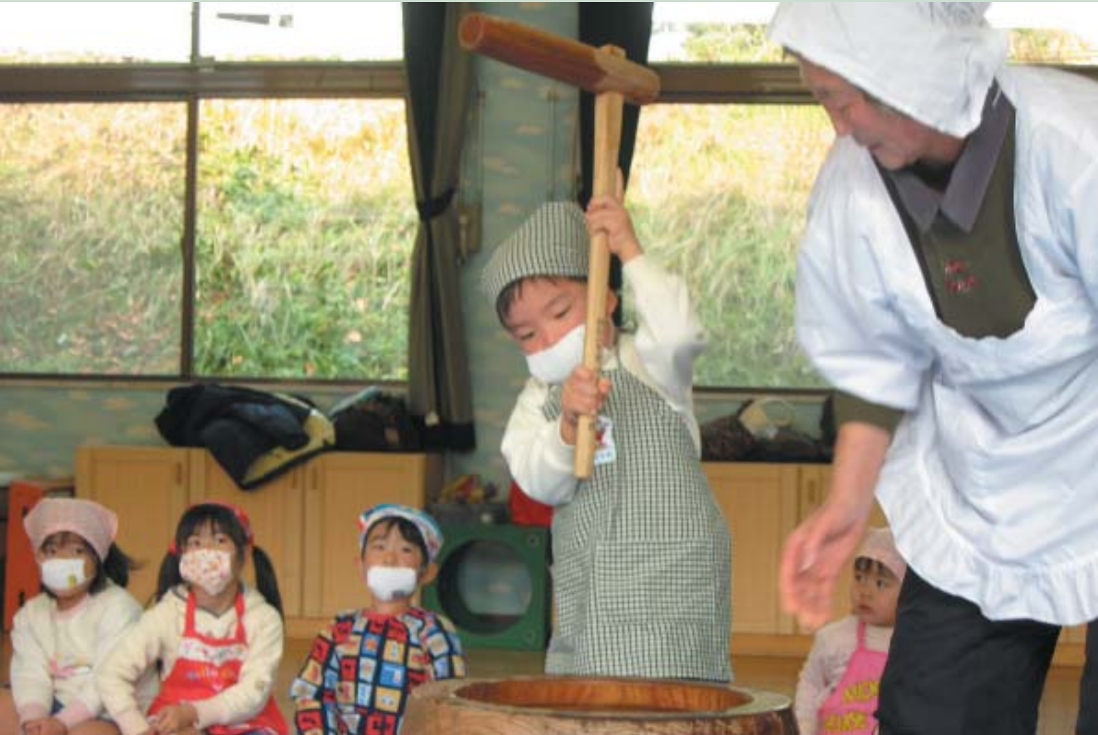
お正月のお餅つき、おばあちゃんとがんばりました