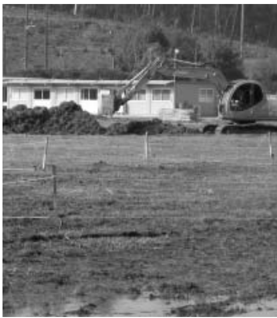
平成21年に操業予定の共栄社化学