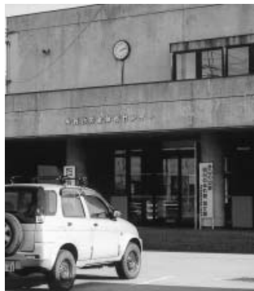
時間外の管理人の配置がなくなった勤労者体育センター

山口議員 町民が利用する時間帯の土日夜間に勤労者体育センターなどは、管理人の配置が必要である。 個人利用をなぜ認めないのか、4月から値上げの影響で利用者が減って用者に変動はないか。 社会教育課長 土日夜間は個人の利用がほとんどなく団体のみとなり、平成17年度より経費節減のため職員配置を廃止したが再検討する。使用料の値上げ後も利用者に変動はない。