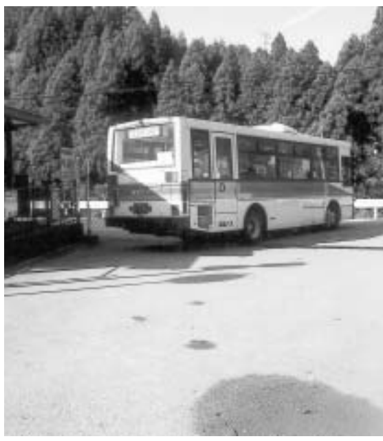
本町にふさわしい交通システム検討中

若林議員 佐用町では外出支援事業として、タクシー代の半額助成制度がある。 本町も外出不自由な人が病院や買物に行けるシステム作りが必要である。 副町長 本町では現在、民生児童委員からの相談も受け、福祉タクシーの助成、医療機関への外出支援サービスなど行っている。 これからの外出支援システムの構築については、アンケート調査等を参考にしたい。佐用町の個別対応型の事例・近隣のデマンド方式的な交通システムを、住民の意向などをもとに本町にふさわしい町全体の交通システムとして検討中である。