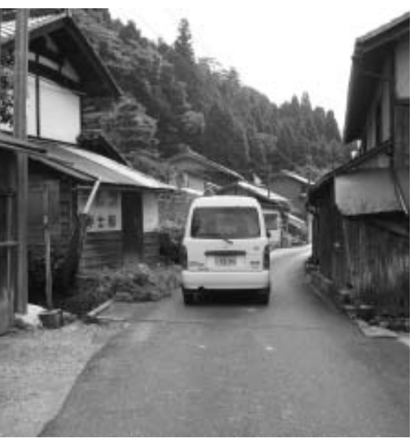
軽四が対向できない県道

水没地区住民代表が知事に要望書を提出したが、相も変わらぬ知事の、のらりくらりの財政難を理由に「今しばらくの間待つてくれ」では地元の人々を馬鹿にした回答である。 多賀町として今後、いかなる考えをもち対処していくつもりか、町長の考えを聞く。 町長 知事は、財政が危機的状況にあることを理由に半年、1年の時間を、との返答である。 ダム建設以外での治水対策が考えられないことを明確にし、粘り強く早期決断と早期実現を求めていく。 水谷の皆さんと全く変わらない気持ちで知事と交渉している。