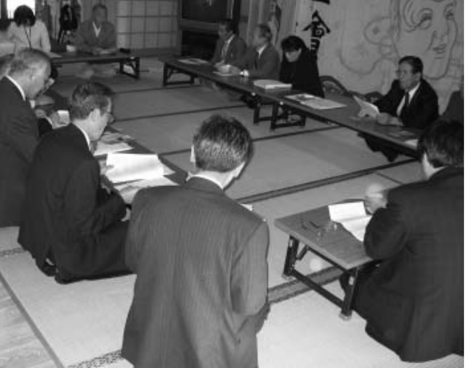
新田人形浄瑠璃の館にて研修