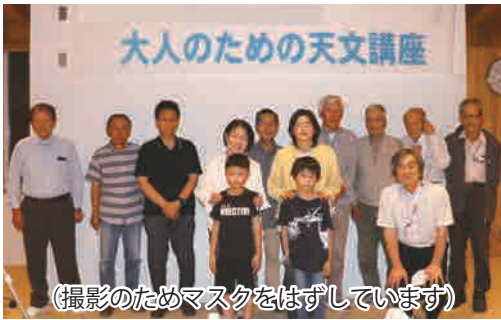
(撮影のためマスクをはずしています)

多賀町中央公民館で毎月1回の講座を開き、望遠鏡を使って月や惑星、人工衛星や季節の星座の星々などの天体観測をおこなう他に、天文学の講義もおこなっています。