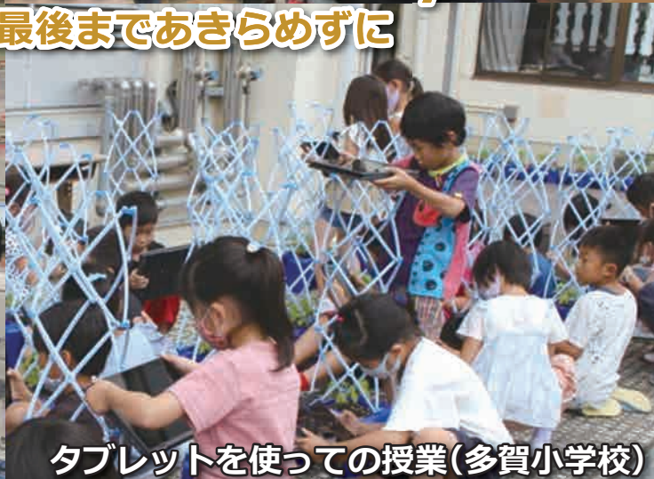
タブレットを使っでの授業(多賀小学校)