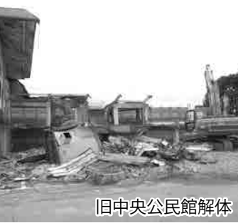
旧中央公民館解体