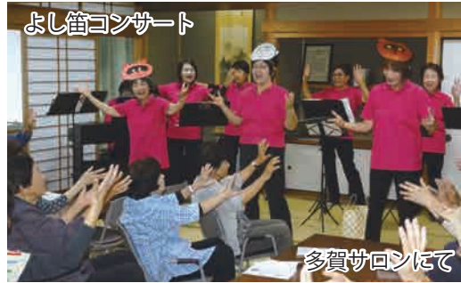
よし笛コンサート