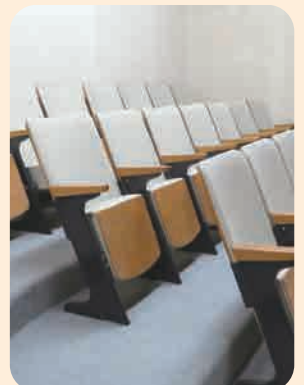
※座席は21席あります。

※日程は、変更になる場合があります。 議会事務局 ☎48-8126 (有線) 2-2011