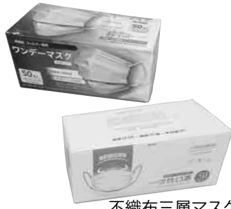
不織布三層マスク

●一人あたり10万円 442万円 ●一人あたり2万円（221人） ●中小企業等経営支援給付金（民間金融機関または政府系金融機関の融資を受ける事業者） 1000万円