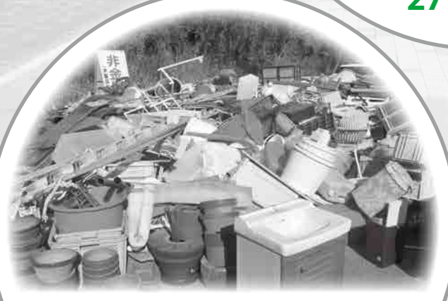
ゴミ処理費 燃えないゴミ・粗大ゴミ 670万円