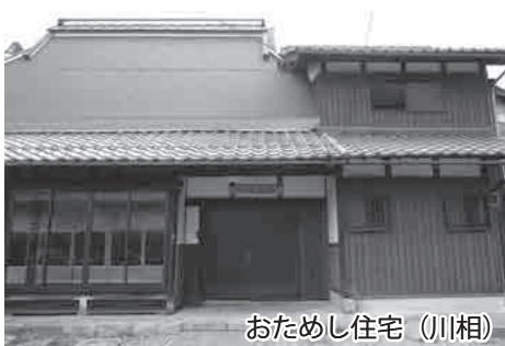
おためし住宅 (川相)

問 公共交通利用促進会議の進捗状況と今後のスケジュールは 企画課長 答 萱原線、大君ヶ畑線を愛のりタクシーの運行に移行させた。現在は、愛のりタクシーが便利な公共交通として、地域の皆様に納得いただけるように取り組んでいる。公共交通利用促進会議を6月中に開催する。