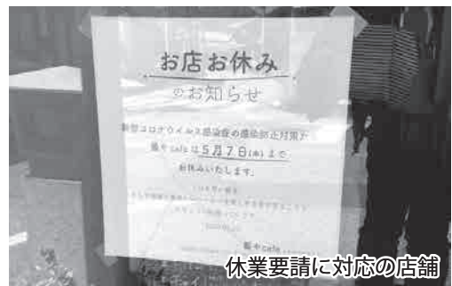
休業要請に対応の店舗

問 ①町内事業者が支援を受けられる制度と町の関わり方は。また、新型コロナに対して専用窓口の設置は 産業環境課長 答 ①県の休業補償(臨時支援金) 中小企業20万円、個人事業主10万円。本町は上乗せ10万円があり、県に委託している。日本政策金融公庫、滋賀県中小企業振興資金、商工中金および民間の金融機関で無利子の貸付制度がある。