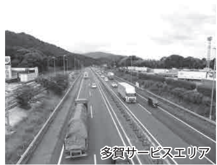
多賀サービスエリア

問 ① 下り線の動線について最終確定はいつごろか。また、上下線の用地買収の進捗度は ② 年末年始、国道307号の大渋滞対策は ③ 名神高速道路の高架橋取り換え工事については計画通りのスケジュールか ④ 多賀大社前駅エリアの基本構想の計画は ⑤ 多賀甲良線が都市計画道路で行き止まりとなり、国道307号中川原から四津屋方面に直進にて進入できる踏切がない。(株)近江鉄道側に今まで以上に働きかけ、早期に新設の踏切を 地域整備課長 答 ① 詳細設計は十月末の予定。用地買収については、設計の完了後に実施する用地測量で面積が確定し実施する。 ② 年末年始の限られた期間の交通渋滞への対策を道路側で実施するのは難しい。 ③ 令和3年早々の着工予定。