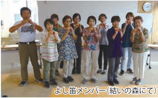
よし笛メンバー(結いの森にて)