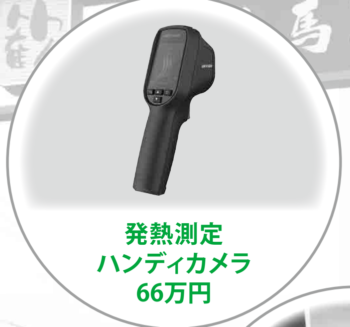
発熱測定 ハンディカメラ 66万円