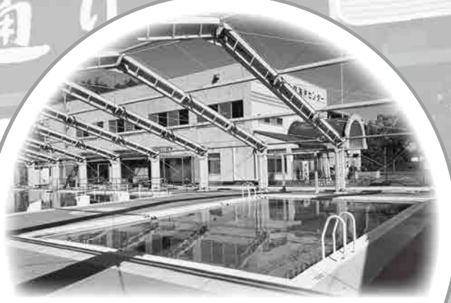
BGプール改修 小プール塗装ほか 2105万円