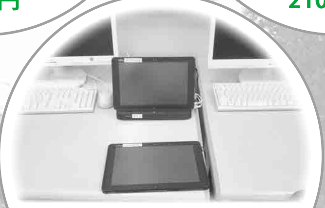
小、中学生にタブレット 2790万円