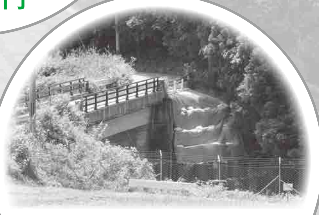
町道法面補強 (霜ヶ原高橋) 600万円