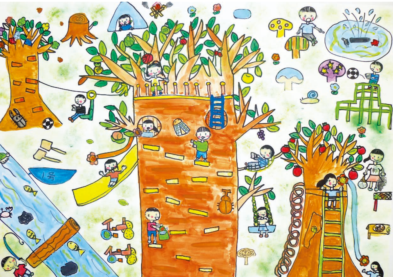
友だちいっぱいのおうちは 多賀町立大滝小学校児童作