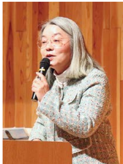
▲講演会では、取材秘話や執筆に込めた熱い思いを語ってくださいました