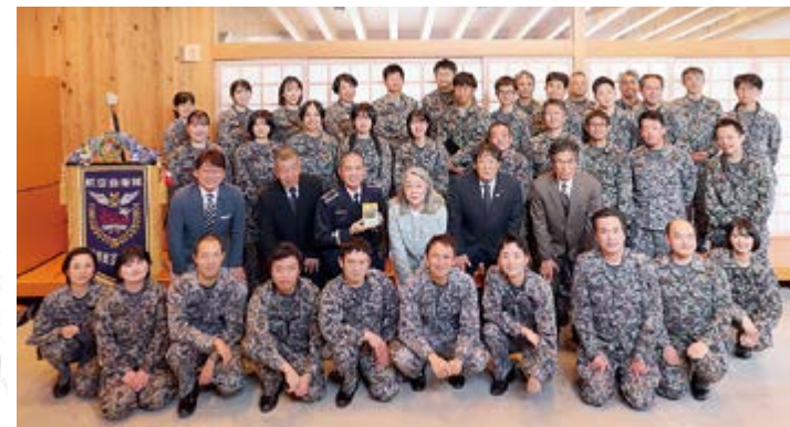
▲航空自衛隊中部航空音楽隊の皆さん