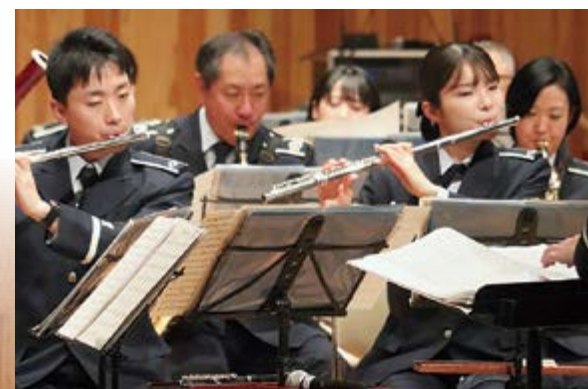
◀素晴らしい演奏をありがとうございました！