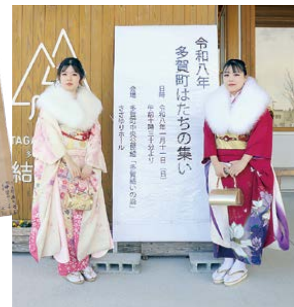
▲再開を喜び合い、記念撮影！