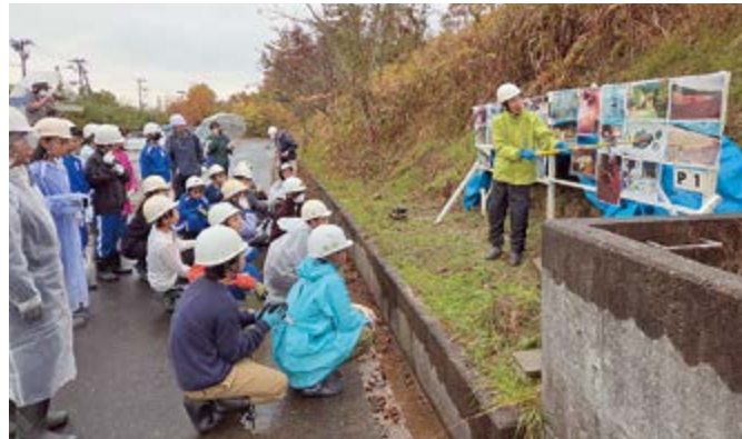
▲何時もご協力いただき、ありがとうございます!

ました。残念ながら、化石を探すためには条件が良くなかったため、昨年のような大物化石は見つかりませんでした。特に、25日は断続的に小雨が降り、薄暗く泥だらけの発掘となりました。しかし、そういった悪コンディションにも関わらず子供達が黙々とひたすら泥に向かう姿に、「さすが多賀の子供たち、りっぱだ!」と感動した今年の野外実習でした。