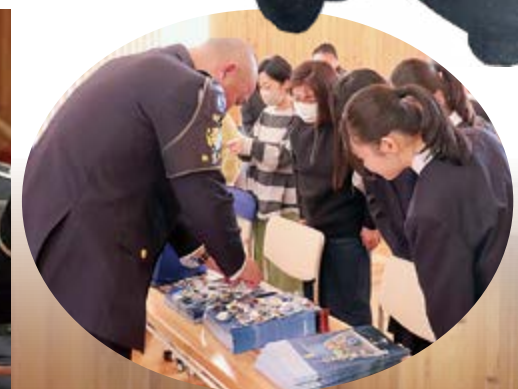
▲自衛隊グッズが配布されました