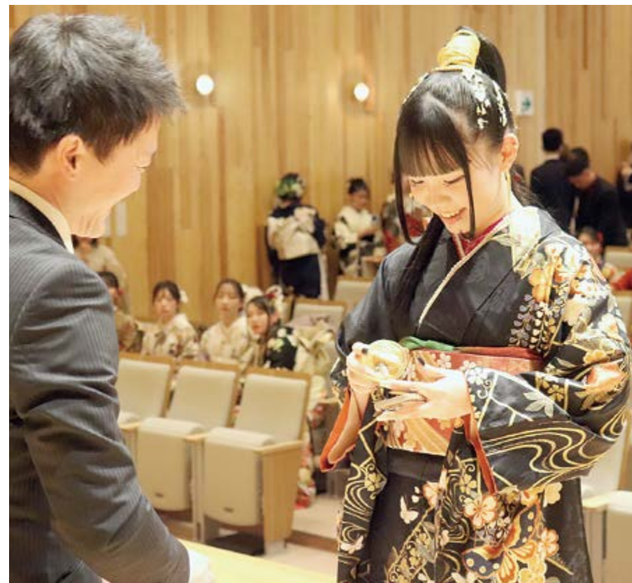
▲タイムカプセル開封！