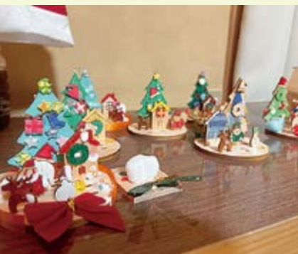
▲クリスマスデスクトップツリー