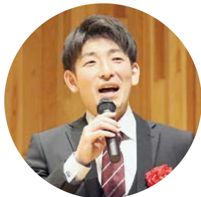
▲恩師からのお祝いの言葉