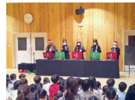
▲ハンドベルの演奏に合わせてうたいました