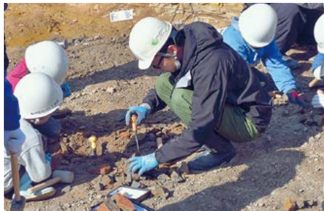
▲参加者は楽しい時間を過ごしました

さて、「親子化石発掘体験」は多賀町立博物館の特色ある事業・秋の恒例事業で、もっとも人気のある催し物の1つです。今後は、実施方法や内容に工夫を凝らし、より多くの方々に参加していただけるように努力したいと考えています。