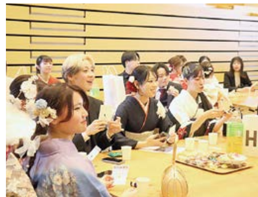
▲番号の発表に一喜一憂