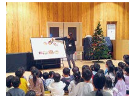
▲歌に合わせてパネルシアターが飾られました

きました。「あわてんぼうのサンタクロース」など3曲をハンドベル演奏され、紙芝居や大型紙芝居などのお話を聞かせていただきました。パネルシアターも取り入れてくださり、クリスマス色に染まった雰囲気の中、子どもたちは楽しい時間を過ごしました。