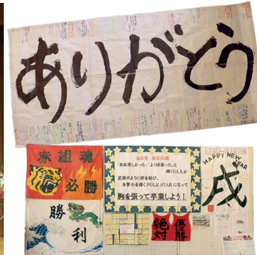
▲小中学校時代の思い出の品が飾られました