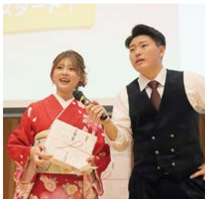
▲白熱したビンゴ大会