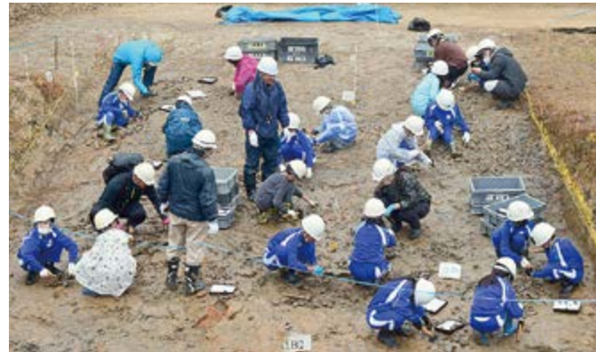
▲黙々とひたすら泥に向かう姿に感動!