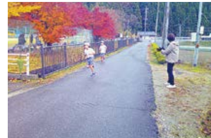
▲応援しながら見守りをしていただきました

「足元が滑るから気をつけて!」と声をかけてくださっていました。例年、交通安全に注意しながら、子どもたちのがんばりを間近で応援していただいています。