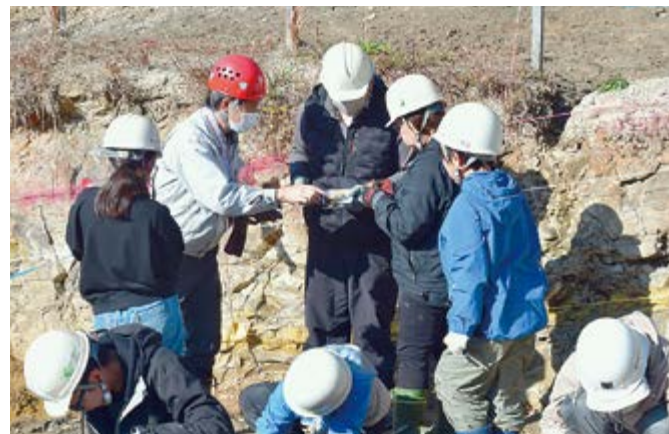
▲じっくりと観察できました