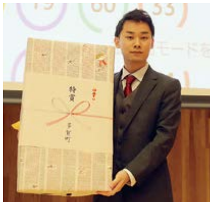
▲ビンゴで特賞を引き当てました！