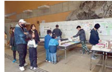
▲計160点の作品が集まりました

夏休み自由研究展は今年で17回目となります。今年は小・中学校合わせて計160点の作品が集まりました。これは過去最多であり、子供たちの中に自由研究に挑戦しようという気持ちが育っていることをうれ