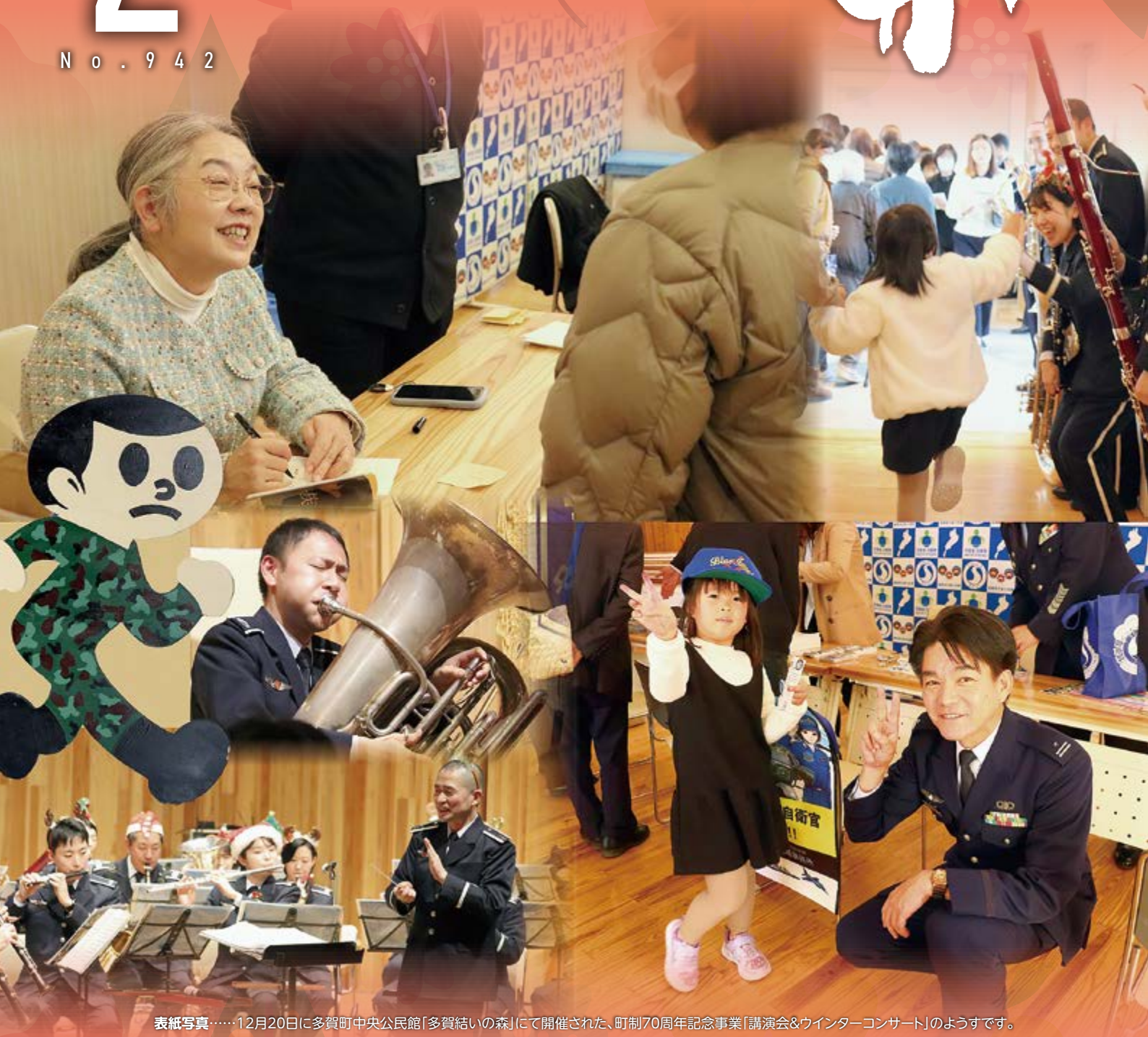
表紙写真……12月20日に多賀町中央公民館「多賀結いの森」にて開催された、町制70周年記念事業「講演会&ウインターコンサート」のようすです。