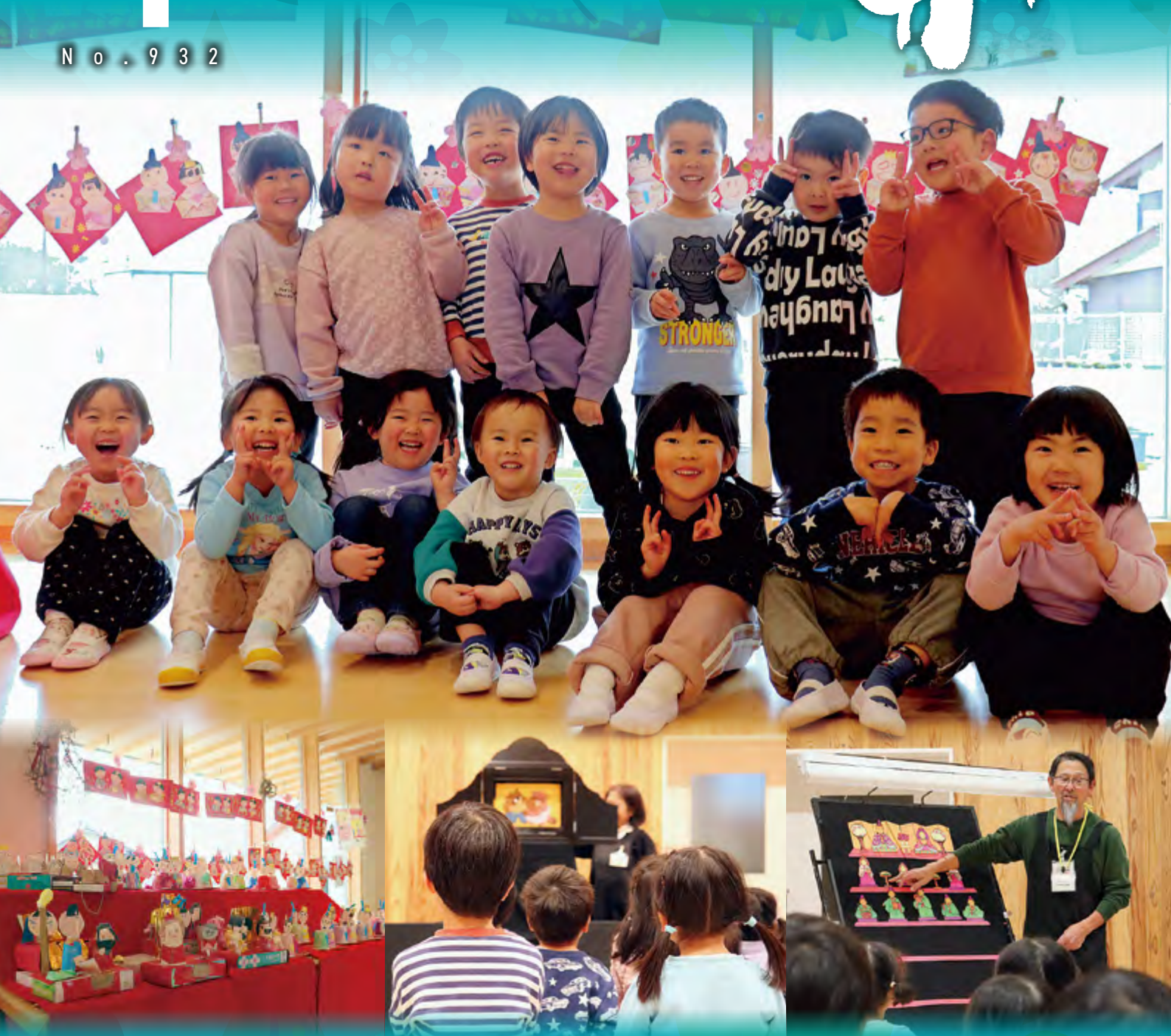
表紙写真……3月3日に久徳うぐいすこども園にておこなわれた「ひなまつり」の様子です。