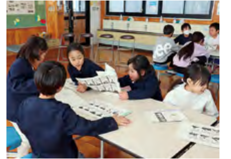
▲百人一首の勉強をしている児童