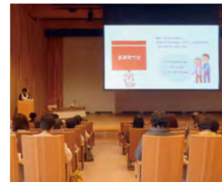
▲赤十字奉仕団取り組み発表のようす