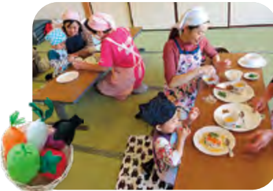
▲きりん広場「親子クッキング」

「私たちの健康は私たちの手で」を スローガンに食生活を通じた健康づくり 活動を進めるボランティア組織です。