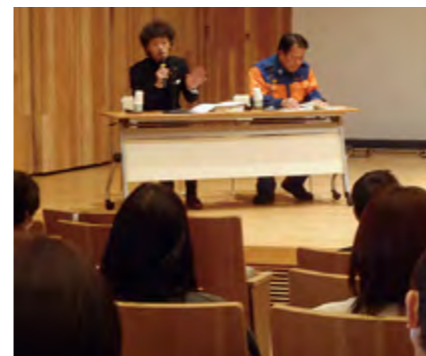
▲「多賀町の防災」取り組み発表のようす

れました。またフォーラムを通して、何気なく日常でしていることが実は「防災」に繋がっているという気付きに繋がるとともに、地域住民同士の繋がりを深める機会となりました。