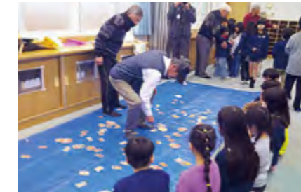
▲めんこの遊び方を教わりました