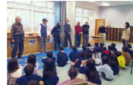
▲ご協力いただいた皆さん

なかったからこんな遊びをしてたんです」などの話もお聞きました。子どもたちからは「めっちゃくちゃ楽しかった」「もっとやりたい」との感想がありました。