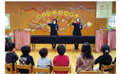
▲たんぼさんによる手品

が聞いたことのある曲でダンスを教えていただき、大変盛り上がりしました。最後には、園児から手作りのお礼のプレゼントがありました。いつも新しいことを取り入れ、みんなが楽しめるように考えてくださっています。