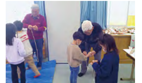
▲コマ回しのコツを教わりました