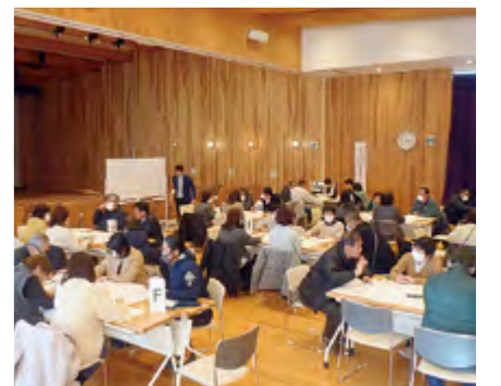
▲グループワークのようす