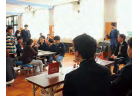
▲キャリア教育のようす