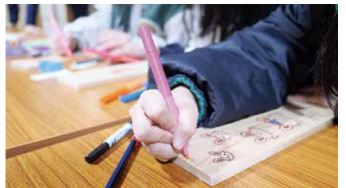
▲ものづくりラボにて羽子板づくり