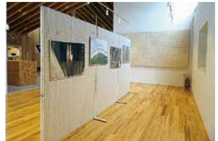
▲ギャラリースペース 33.13㎡

多賀町中央公民館 「多賀結いの森」には、無料でご利用いただけるギャラリー (展示スペース) があります。サークルの皆さんの作品展示や、学校・地域の方々、個人の方もご利用いただけます。趣味で撮られている写真や手作り作品などを展示してみませんか。展示パネルなども貸し出していますので、自由にレイアウトできます。