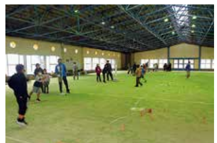
▲昨年度のモルック大会のようす

「第2回多賀町モルック大会」を開催します。モルックとは『モルック』と呼ばれる木の棒を投げ『スキttl』と呼ばれる数字が書かれた木の棒を倒して点を取り、合計点が50点ぴったりになる早さを競う遊びです。初めての方、小さな子ども、高齢者の方など、誰でも簡単に楽しむことができます。交流大会ですのでお気軽にご参加ください。お一人の参加も歓迎です! ■日時 3月19日 (日) 10:00 ~ ■場所 多賀町屋内多目的運動広場 ■お問い合わせ・申込 中央公民館「多賀結いの森」