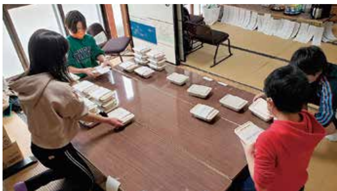
▲お弁当の帯巻きのようす

毎月第4日曜日に開催している『おおたきものづくりラボ』は、居場所としてだけでなく、今後ものづくりを通して子どもたちが挑戦できる場としても、活用していけるようにしたいと思っています。今は言語化できなくても「自分の地域、なんかいいなあ。好きだなあ。」と子どもたちが自然と思えるような地域の魅力に触れる機会をこれからもつくっていきたいです。