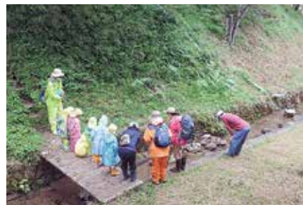
▲魚を見つけました