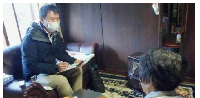
▲地域の方への聴き取りのようす