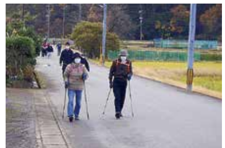
▲ウォーキングのようす

11月27日 (日) 清々しい秋晴れの中、犬上郡スポーツ協会主催の「第12回犬上ふるさとウォーク」が、昨年に続き多賀町で開催されました。中央公民館「多賀結いの森」を発着とし、久徳、一円、八重練、大岡、四手を周回する約4.8kmのコースを設定。今回は96人の方にご参加いただき、多賀町の田園風景を堪能しながら、心と体の“二刀流”でリフレッシュしていただきました。来年度は甲良町周辺が会場となりますので、ぜひご参加ください。