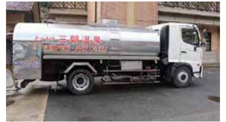
▲三朝町「温泉タンクローリー」

今回の事業は、友好姉妹都市盟約5周年を記念しておこなわれたもので、11月24日早朝より三朝町副町長様をはじめ4人の職員の方が温泉