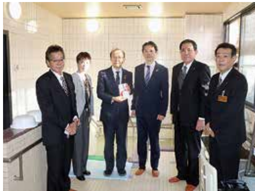
▲犬上ハートフルセンター