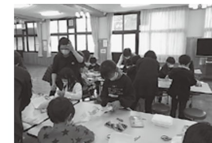
▲サークルさんとびっくり箱作り