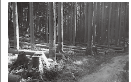
▲作業道が作られ、間伐がおこなわれた山林