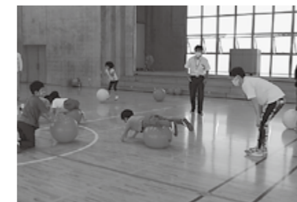
▲バランスボール体験