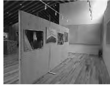
▲ギャラリースペース(33.13㎡)

結いの森で展示してみませんか。展示パネルなども貸し出しいたしますので、自由にレイアウトしていただけます。皆さんの素敵な作品で公民館を美しく彩りましょう！お申し込み、お問い合わせは中央公民館までお願いします。