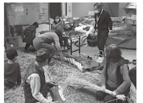
▲わらでアケボノゾウ骨格(原寸大)を作成しました

今後、博物館では「アケボノゾウ化石多賀標本」の価値をより一層高めるために、さらなる調査・研究を推進します。また、小・中学校の郷土学習や観光資源としての発信、地域産業(商品開発や農業など)の取り組みなどにも、アケボノゾウを取り入れていただくことで多賀町がもっと元気になるように働きかけていきたいと考えています。アケボノゾウと一緒に、夢のある多賀町の未来をつくっていきましょう!