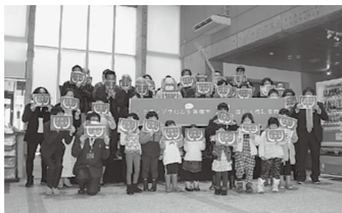
▲アケボノゾウプロジェクトのイメージイラストと記念撮影!