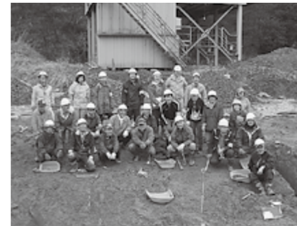
▲古代ゾウ発掘プロジェクト第3次発掘参加者

子どもから大人までさまざまな立場の人たちが参加し、夢を一緒に語らい、成果を発信することは、町づくりに向けた実践の第一歩といえるのではないのでしょうか。2019年に策定された多賀町歴史文化基本構想では、アケボノゾウ化石が関連文化財群のテーマの一つとして位置付けられ、ジオパーク構想や町づくりへの活用についても示されています。