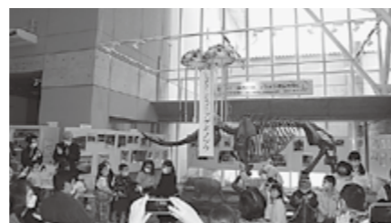
▲子どもたちがくす玉を引いてくれました

ゾウ化石”のお披露目がされました。終始盛り上がりを見せ、多賀町にとって歴史に残る一日となりました。