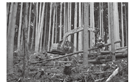
▲林業機械で木を伐採、造材しているようす