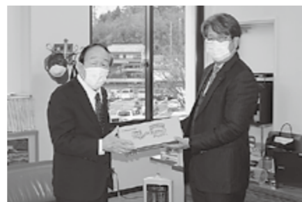
▲放課後児童クラブへ贈られます

麒麟ビバレッジ株式会社滋賀工場から、昨年に引き続きお菓子を寄贈していただきました。寄贈していただいたお菓子は多賀町の放課後児童クラブへ贈られます。ありがとうございました。