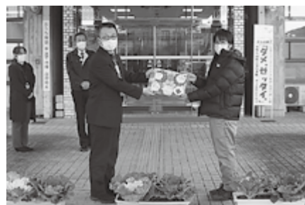
▲役場正面玄関に飾っています

葉牡丹の花は役場正面玄関に飾らせていただいております。ぜひ皆さんご覧になってください。