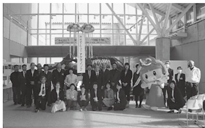
▲セレモニーに出席した皆さん