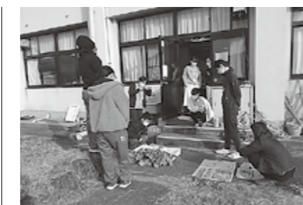
▲成長した大根の販売