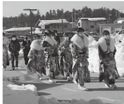
▲会場に入る新成人の皆さん