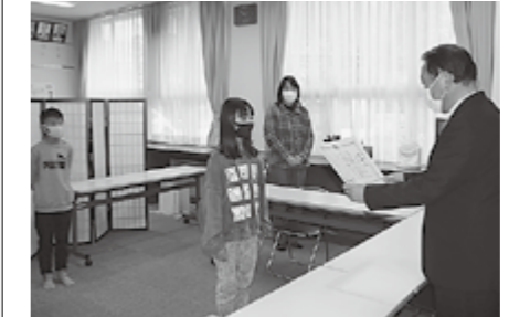
▲多賀小学校(環境委員会委員長)