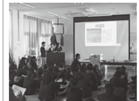
▲パワーポイントを使って発表しました

できることを考えたり、戦争をクラスや友人関係などの身近な場面に置き換えて考えたりする児童も見られ、新たな気づきの時間となりました。