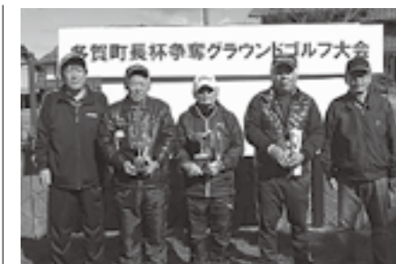
▲おめでとうございます