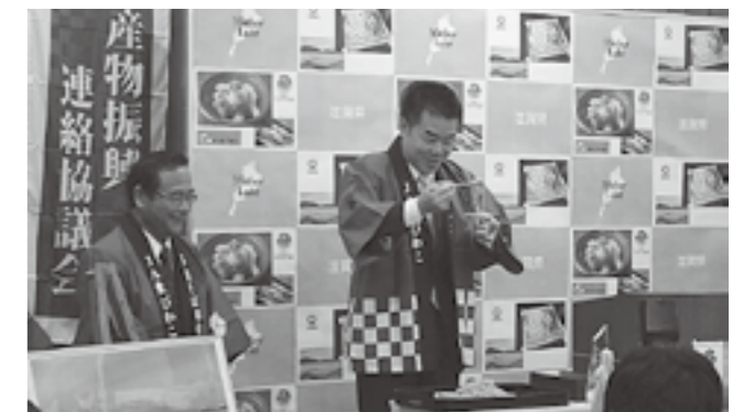
▲多賀そばを食されました