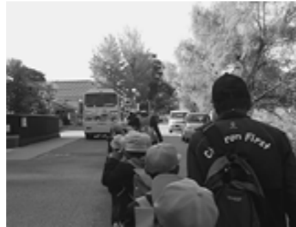
▲狭い道路も注意をして歩きます

11月4日、2年生の校外学習に6人のボランティアの方が協力してくださいました。雨で一週間延期となりましたが、「秋みつけ」「みんなでのしくあんに！」と約束し、一緒に電車に乗って彦根まで行きました。狭い道路では注意を促しながら歩き、キャスルロードでのウォークラリー中の道路横断など、安全見守りをおこなっていただきました。ボランティアの方には、昼食時には各班に混ざり過ぎていただきました。帰りも切符の購入や乗車体験が初めての子どもたちを見守りながら、無事に学校まで帰って来ることができました。