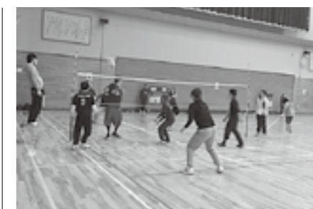
▲今年も参加をおまちしています

申込方法や競技内容などの詳細は、多賀町体育協会事務局(多賀町教育委員会事務局生涯学習課内)までお問い合わせください。