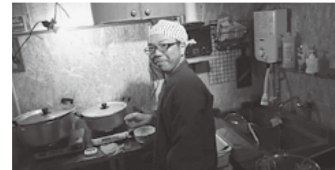
▲そば以外の料理にも勉強中です

営業もおこなわせていただいています。ここでは、料理学校で勉強した出汁巻玉子や親子丼を披露させていただき、まだまだ勉強不足ではありますが夢の実現に向けて一歩ずつ前進しています。地域おこし協力隊として、残りわずかの任期となりましたが、多賀町内でのそば屋起業を目指して行動していきますので、皆さん今後もよろしくお願いいたします。