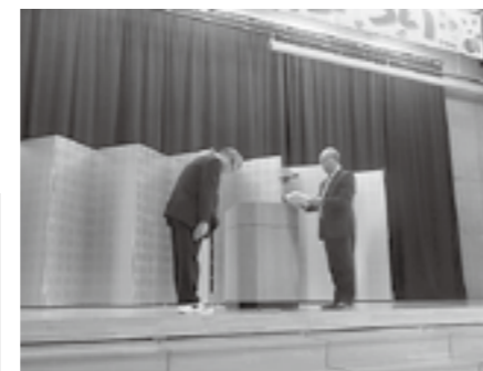
▲大滝小祭りでのお披露目式