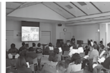
▲昨年の保護者研修会のようす

お申し込みなど詳細については、多賀町スポーツ少年団事務局(多賀町B&G海洋センター内)までお問い合わせください。