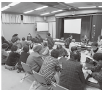
▲住民懇談会のようす

るのでは？ このような取り組みを村全体で今後考えてみたい=自立 今後、地域支え合いの充実グループでは懇談会での意見をどのようにして活動につなげていくか、住民さんとともに知恵を絞り、活動を支援していきたいと考えています。