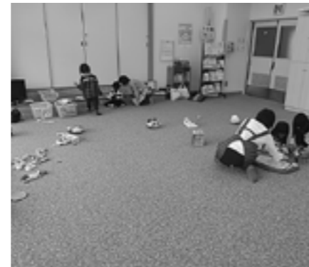
▲就学時健康診断時のようす