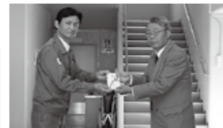
▲杉の子作業所への贈呈式