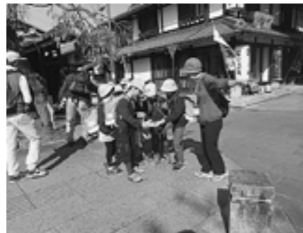
▲ウォークラリーのポイントを見つけました