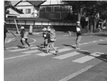
▲交通量の多い道路も安全に渡れました