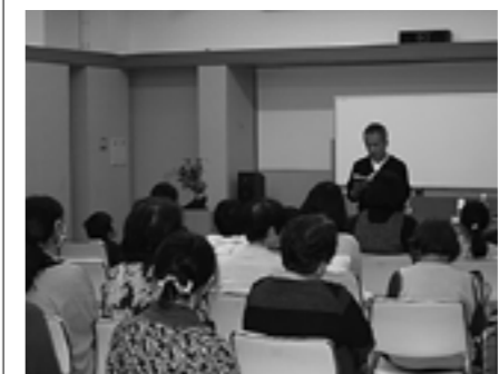
▲要冷蔵さん朗読会