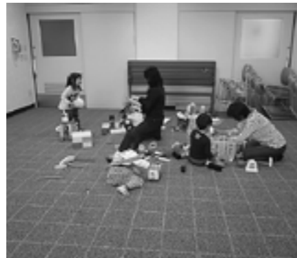
▲シンポジウム時のようす

10月22日と11月17日、多賀町主催の各種行事がふれあいの郷でおこなわれ、保護者が講演会に参加されている間の託児をしていただきました。協力していただいたのは両日でのべ5人の方で、0歳児から入学までの乳幼児の託児でした。子どもたちはなかよく折り紙をしたり、ブロック遊びやお絵かきをしたりして、ボランティアの方と一緒に過ごしました。