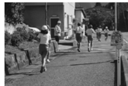
▲応援しながら見守っていただきました

いる中、2学年ずつスタートしました。ボランティアの方は、あきらめずに走りきる姿に大きな声で声援を送りながら、最後まで安全を見守っていただきました。