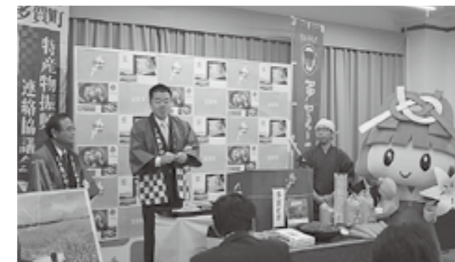
▲県庁での会見の様子

初めセット』、多賀町産のお米『秋の詩』、純米酒『多賀秋の詩』などの特産物が並び、たがゆいちゃんもPRのために駆けつけてくれました。今後も多賀町の特産物を県内外に広く発信していきたいと思