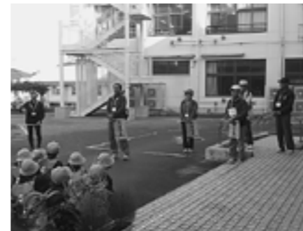
▲お世話になったボランティアの皆さん