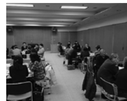
▲図書館協議会交流会