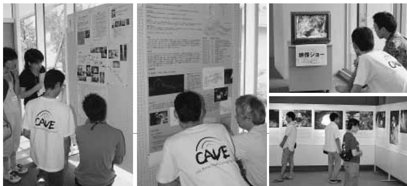
▲会場では、ポスターセッション、映像ショー、写真展を通じて洞窟のおもしろさ、すばらしさが紹介されました。