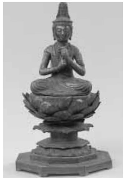
▲銅造大日如来坐像・町指定文化財(大字敏満寺所蔵)

関連企画 ●シンポジウム「敏満寺は中世都市か？」 敏満寺がどんなお寺だったのか解明する討論会です。 日時 11月27日(日) 13時30分 場所 あげぼのパーク多賀・大会議室