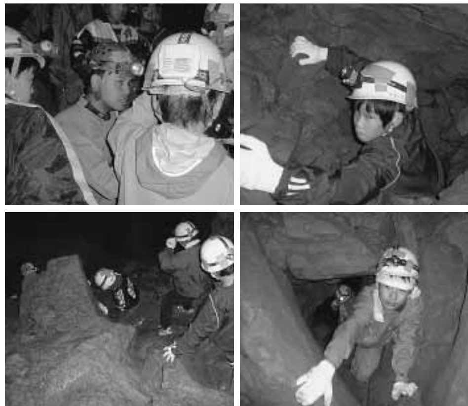
▲河内の風穴の深部へ!! はじめて見る世界に感動しました!!

ん何気に見ているコウモリの不思議な生活ぶりを知る良い機会となりました。 3日間を通じた洞窟学会は事故もなく無事に閉会しました。今回の学会で河内の風穴の自然的価値が上がり、多くの注目を浴びることになりました。 また、現時点で測量されていない支洞もいくつかあり、総延長はまだ伸びる可能性があるということです。