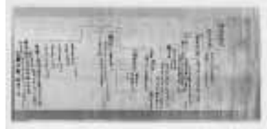
▲舍利相承図・町指定文化財(大字敏満寺所蔵)

関連企画 ●シンポジウム「敏満寺は中世都市か？」 敏満寺がどんなお寺だったのか解明する討論会です。 日時 11月27日(日) 13時30分 場所 あげぼのパーク多賀・大会議室