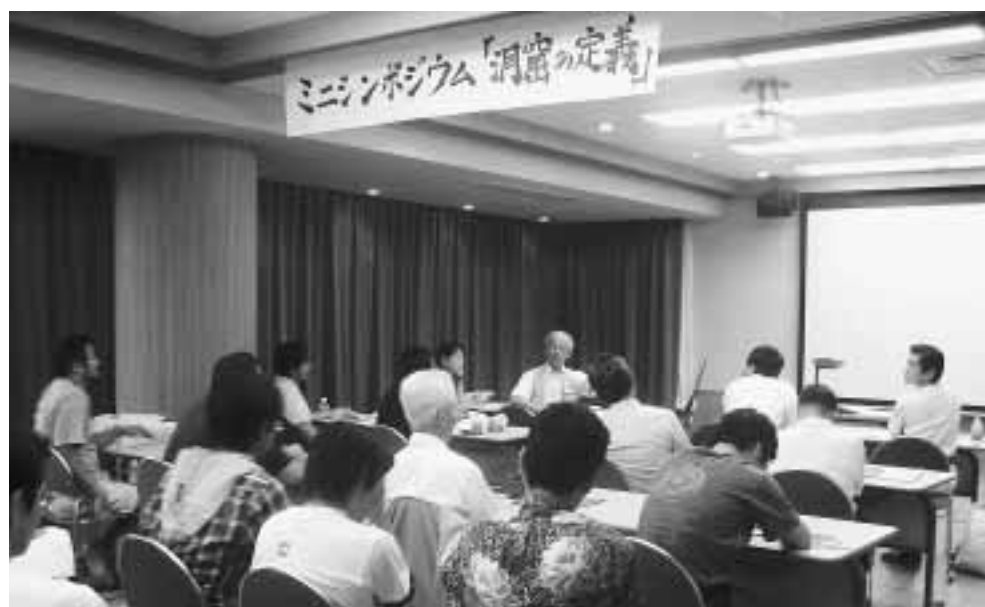
▲「コウモリ」と「洞窟の定義」のミニシンポジウムでは熱心な議論が続きました。