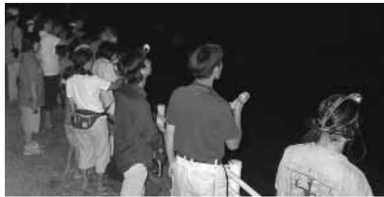
▲コウモリ観察会のようす。「あっ、あそこにいるよ!!」