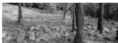
▲石仏谷墓跡・国指定史跡

内容 国史跡指定になった敏満寺石仏谷墓跡(中世の墓地)を中心に展示です。発掘調査の成果や、地元で伝承する文化財を紹介し、謎にまつまれた敏満寺の歴史を解明します。