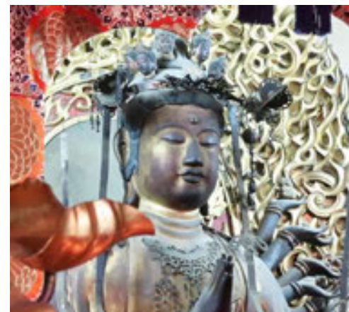
伝聖徳太子御作千手観音像

滋賀県の鈴鹿山麓にある、東近江市博物館グループ(近江商人博物館、中路融人記念館、西堀榮三郎記念探検の殿堂、能登川博物館)・愛荘町立歴史文化博物館・多賀町立博物館が中心となり、関係する多賀町・愛荘町・近江八幡市・東近江市・竜王町・日野町の観光協会や民間企業とも連携し、鈴鹿山麓の歴史・文化を地域の資源として発信するため、2018年に結成された団体です。