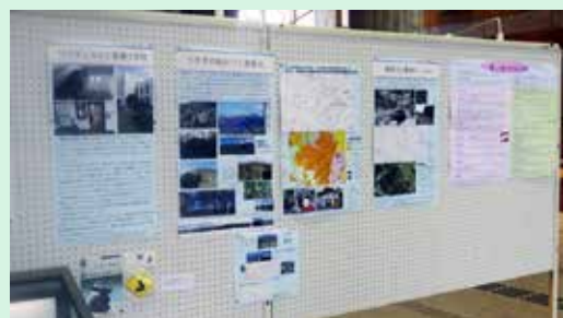
ウサギとカメ、ウサギの名の山・川、ことわざ