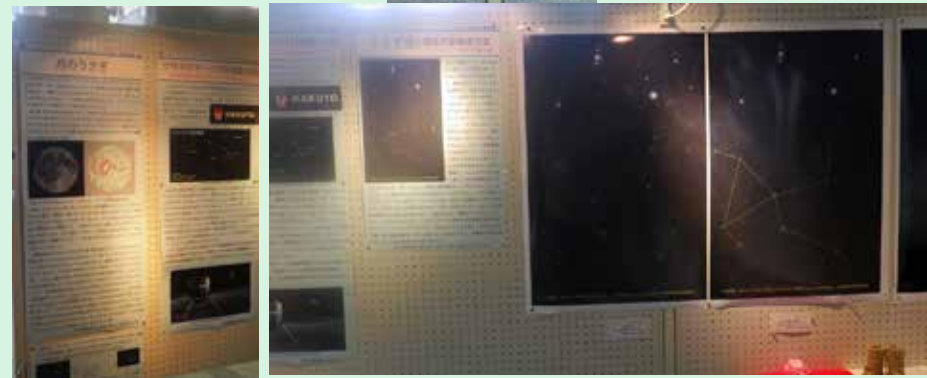
「月とウサギ」の話題「うさぎ座と脈動変光星」うさぎ座の美しい星座写真など