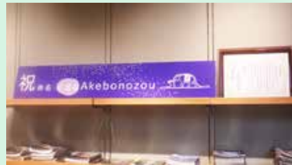
小惑星 Akebonozou の命名 (2022)

2023年は、国指定天然記念物「アケボノゾウ化石多賀標本」で盛り上がる年です。3月にはアート展やシガタガゾウのサト祭りがあります。ご協力よろしく！