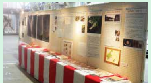
ウサギと図書の話題や卯の花のあれこれを展示