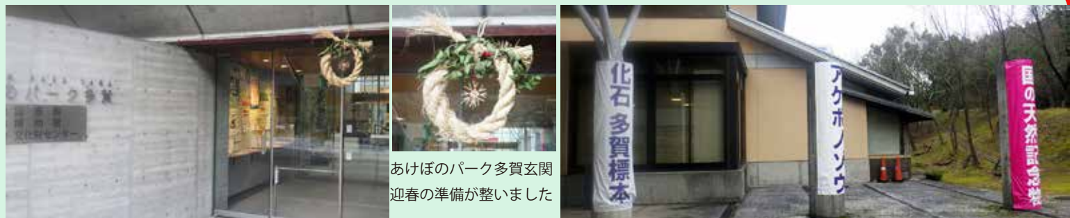
あけぼのパーク多賀玄関 迎春の準備が整いました