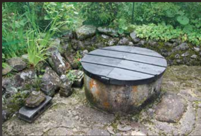
光秀ゆかりの井戸