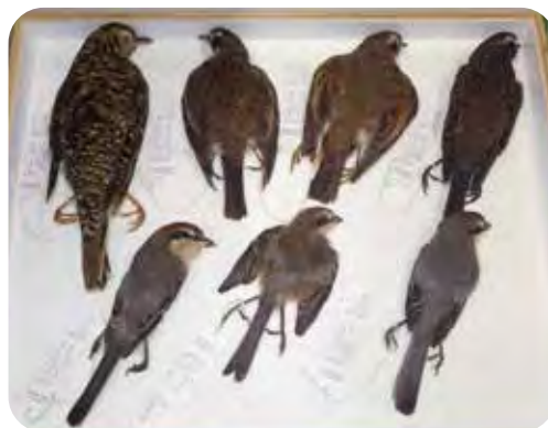
「仮」と呼ばれるけど完成型の仮剥製たち

多賀町では、これまでに110種にのぼる鳥類が確認されています。記録の多くは目視観察や写真によるものですが、実物の標本は多くの情報を持つ確かな証拠として重要です。この企画展では博物館が収蔵している鳥類コレクションの中から、「ちょっと訳ありな経歴」の持ち主たちの横顔を紹介します。