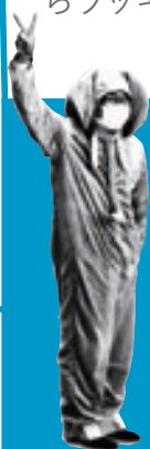
多賀町立博物館 館長