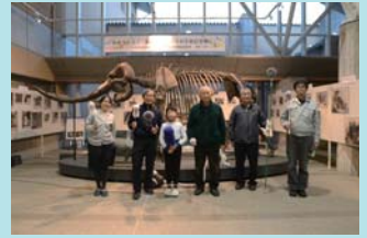
令和3年12月23日 アケボノゾウの年末すすはらい