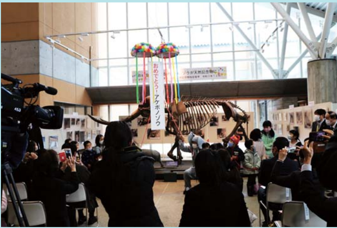
令和3年12月18日 答申を祝う祝賀行事 くす玉割り

多賀町役場に "垂れ幕"が！！ "国の天然記念物" アケボノゾウの コーナーができ ました。