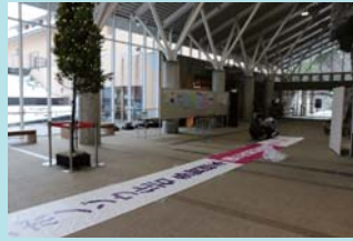
令和3年12月21日 垂れ幕完成！ ホールで