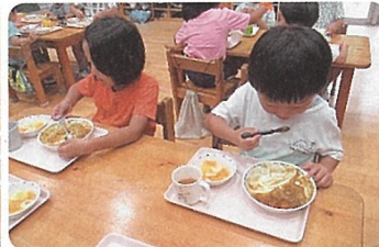
みんなで カレーパーティー JAや地域の方も来 てくださってとて も楽しく美味しく いただきました