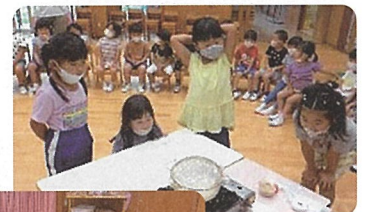
おにぎり クッキング