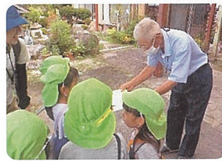
お米がとってもおいしかったので、ありがとうの気持ちを伝えるためにカレーパーティーのお手紙を書いたよ