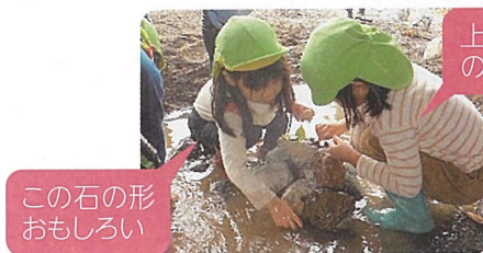
この石の形 おもしろい