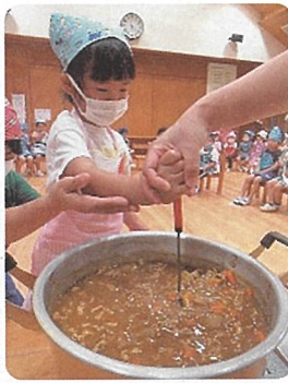
カレーライスクッキング みんなで役割を決めて 作ったよ