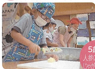
5歳児 人参の皮むき じゃがいも切り