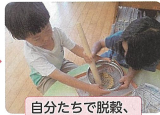
自分たちで脱穀、 精米にチャレンジ