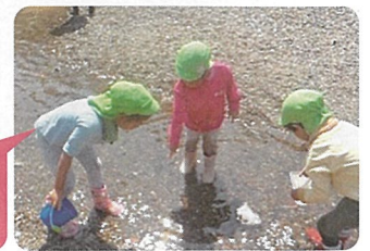
あっ!! あそこに 魚がいる