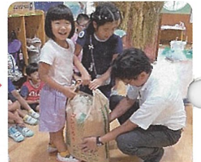
JAの方がお米を 届けてくれたよ