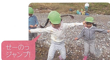
せーのっ ジャンプ!

今年度は、高取山だけでなく川相の川原にも自然体験活動へ出かけました。川原につくと、子どもたちは水の流れる音、心地良い風、とても冷たく気持ちいい水などを五感で感じながら全身を使っておもしろいあそびました。いろいろな形の石を見つけて積んだり基地を作ったり、魚を見つけたりと川原ならではのあそびを楽しみました。