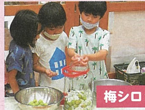
梅シロップづくり

地域の方からも梅をたくさんいただいたので梅干しづくりにチャレンジ。梅を塩漬けにし、赤しそで色を付けたら真っ赤な梅干しができたよ。ごはんと一緒に食べるととってもおいしいよ!