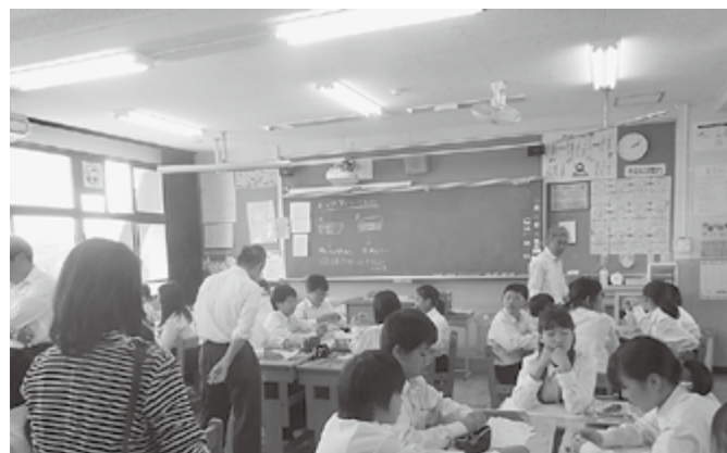
▲中学校の公開授業を参観

手なつきあい方」等に取り組みます。6月12日には、多賀中学校において第1回校区研究会を開催しました。公開授業で子どもたちのようすを参観した後、全体会では教育長からのお話があり、その後3つの部会に分かれて、今年度の目指す子ども像や取り組み内容について研究協議をおこないました。