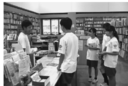
▲カウンター業務を疑似体験

本の返却や整理はもちろん、ふだんは見えない書庫での作業や、本のカバーかけ、移動図書館などのいろいろな仕事を体験しました。