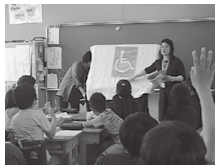
▲パネルシアターを使って説明くださいました

サークルのメンバーの方々も「毎回勉強になります」と活動してくださいています。今後、大滝小学校でも同様の学習を予定しています。