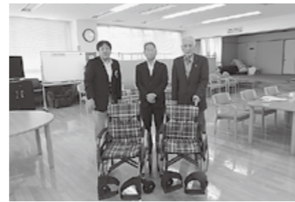
▲大切にに使わせていただきます

寄贈いただいた車椅子は各集落に貸与・譲与しています。また社会福祉協議会でも短期間の貸し出しをおこなっています。