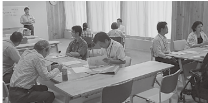
▲語ろう会のようす

昭和25年に制作された日本各地の優良公民館の活動を紹介した映画で、戦後間もない時代に公民館が果たした役割から学ぶことも多く、令和時代の公民館のあり方について考えるよい機会になりました。