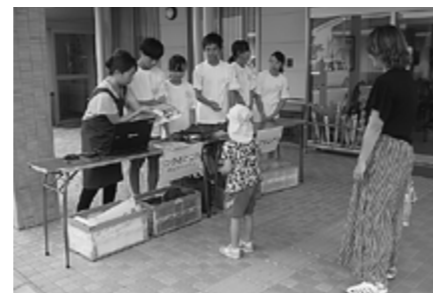
▲移動図書館のようす