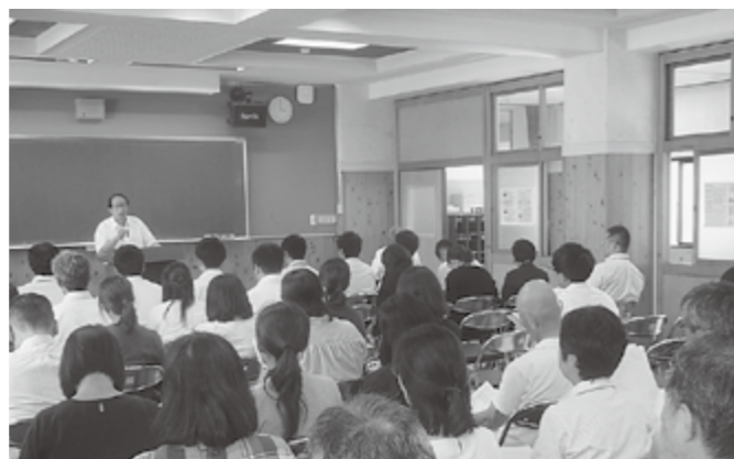
▲全体会での教育長講話