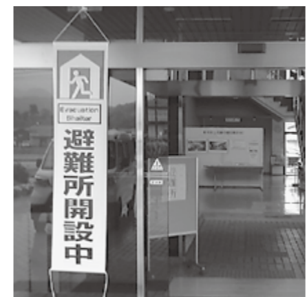
▲避難所開設時にはこのようなマークが表示された垂れ幕が掛けられます