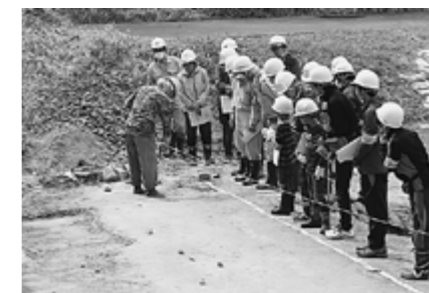
▲足跡化石の説明を受けるようす