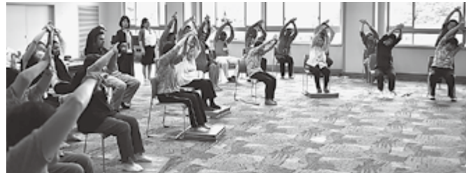
▲一緒に体操を体験