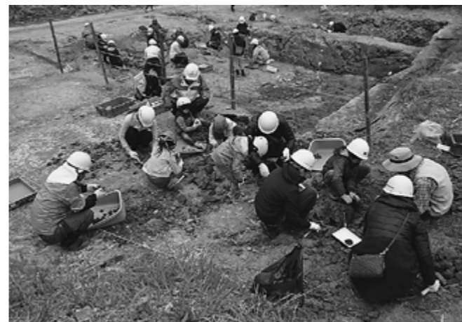
▲親子化石発掘体験のようす

虫、魚の咽頭歯、貝など412点です。シカの骨やカメと思われる化石も見つかっており、180～190万年前の多賀町のようすが詳細にわかりました。今後もアケボノゾウの発見をめざし、調査を継続していく予定です。