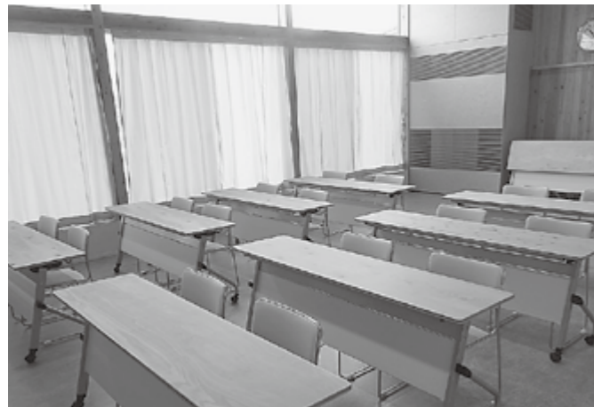
▲きれいな自習室で勉強に励みましょう

今年も公民館の空きスペースを自習室として開放します。木の香りのする素敵な公民館で勉強をしてみませんか？