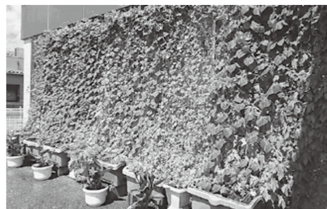
▲作品を募集します!

地球温暖化防止の一環として、夏の省エネルギーを図るため、ゴーヤやヘチマなどのつる性植物による緑のカーテンを、家庭や店舗・事業所などで普及させることを目的として「緑のカーテンコンテスト」を実施します。