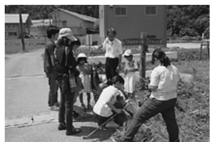
▲昨年のいきもの採集の様子