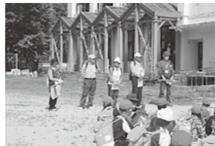
▲ご協力いただいたボランティアの皆さん

6人の方にサポートしていただきました。大変暑い中、6つの班に分かれて歩く児童に、ボランティアさんは、「あと少しやで」「車に気を付けて」と声をかけておられました。お昼にはおいしいお弁当を一緒にいただき、楽しい時間を過ごされました。