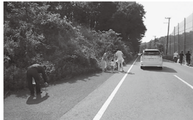
▲各地で皆さんに活動していただきました

ご参加いただいた皆さん、ありがとうございました。今後も、多賀町に関わる人たちの力で、より住みやすい多賀のまちをつくっていきましょう。