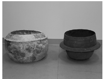
▲左 中世の土製釜、右 近世の鉄製釜