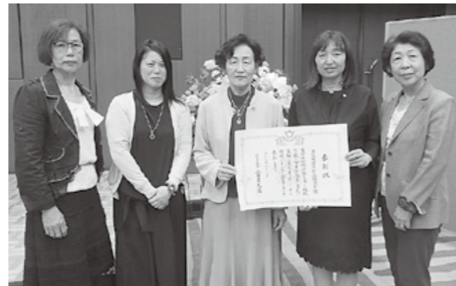
▲健康推進委員の皆さん

多賀町の健康推進員は、バランスの良い食事を広めるヘルスクッキング教室や生活習慣病予防のための減塩推進活動、子育て支援センター、保育園幼稚園、小中学校での食育活動、一日350gの野菜の摂取の啓発や運動の普及など、さまざまな活動をされています。今回、その活動が評価され、知事賞を受賞されました。地域の皆さんが健康で過ごしていただけるよう各字で活動されています。