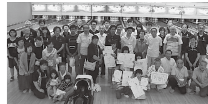
▲ボウリングを楽しみましょう!

7月14日(日)に多賀町スポーツ協会主催による「町民ボウリング大会」が開催されます。当大会には、毎年、参加して下さる方も多く、改めて世代を超えて、たくさんの方に愛されるスポーツなのだと感じています。今年度は、彦根市のラピュタボウルにて開催されます。お申し込み方法など、大会に関する詳細は、多賀町スポーツ協会事務局(多賀町B&G海洋センター内)までお問い合わせください。