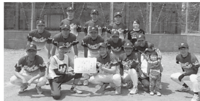
▲優勝したワイルドキャッツの皆さん

真夏を思わせる炎天下の中、5チームが熱戦を繰り広げ、ワイルドキャッツが優勝されました。