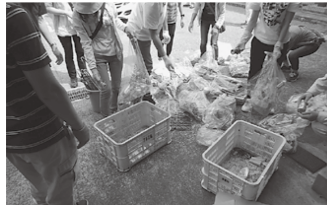
▲たくさんのごみを回収しました