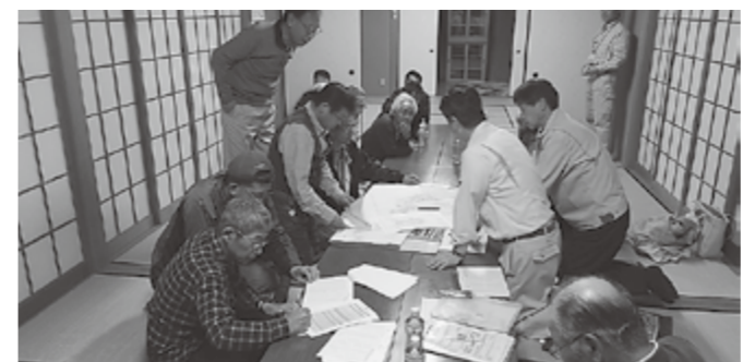
▲八重練での話し合いのようす

このプランは、農業が厳しい状況に直面している中で持続可能な力強い農業を実現するため、それぞれの集落において話し合いをおこない、集落が抱える人と農地の問題