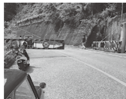
▲片側交互通行にて通行可となった国道306号

また、当面の間は片側交互通行のままとなりますので、通行される際は十分に注意してください。