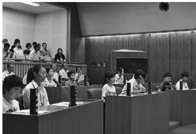
▲昨年の「子ども議会」の様子

■その他 傍聴を希望される方は、人数に限りがありますので議会事務局までお申し込みください。(子ども議員の保護者1人は優先します。)