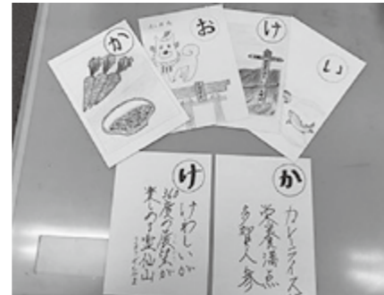
▲皆さんが作られたご当地カルタ