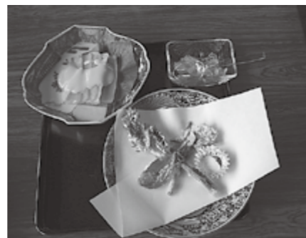
▲とてもおいしそうです