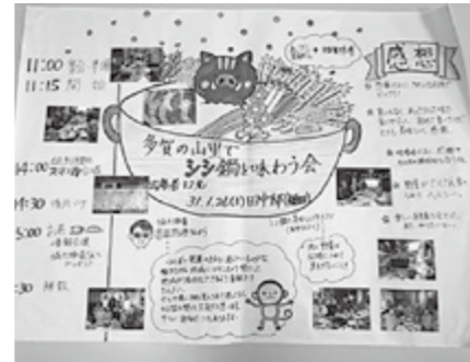
▲牡丹鍋(しし鍋)を楽しみました

があがり、食材の手配など計画を立て、実施し、写真や感想の入った楽しい報告をされました。企画の際、地域おこし協力隊にも参加してもらおうと声があがり、鍋を食べながら協力隊の活動について話を聞くこともできました。