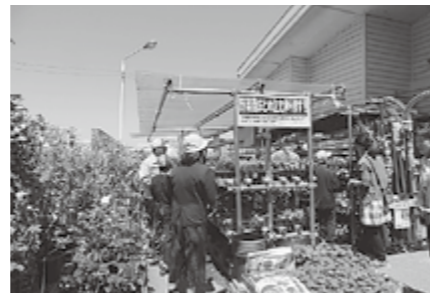
▲苗購入体験の見守り