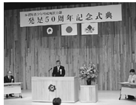
▲池尻会長のあいさつ

この会議は、各種団体の代表者が「常任委員」に、区長や字推薦の方が「代議員」となり、町民一丸となって青少年の健全育成を推進するため昭和44年に結成されました。