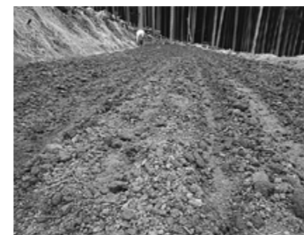
▲種まきが完了した畑

7月・8月には畑の草取り、11月には収穫祭が予定されており、今回参加された皆さんは収穫祭には必ず参加したい、と意気込んでおられました。