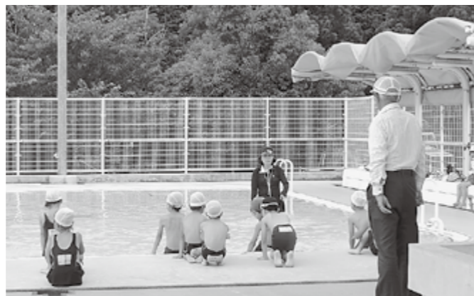
▲プール監視のようす