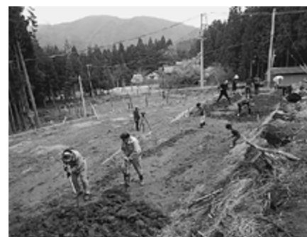
▲一生懸命耕します

今年は畑を耕すところから始まりました。4チームに分かれ、作業場所を分担して手作業で耕うんをおこないました。畑の敷地はそれほど大きくはありませんでしたが、粘土質の土壌を