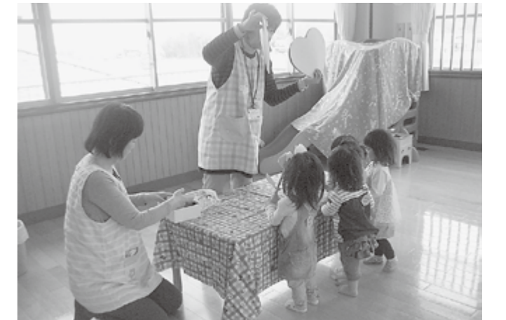
▲登録制広場のようす