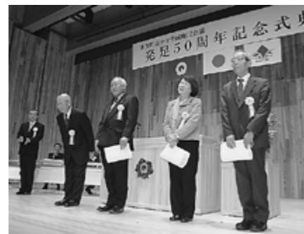
▲表彰を受けられた皆さん

に育ってほしいと町内の保育園や小学校など10団体に「木育おもちゃ」が贈られました。