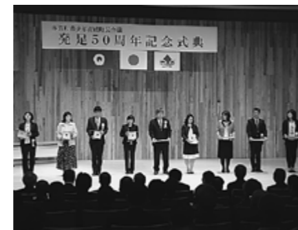
▲木育おもちゃの贈呈

最後に、50周年を祝う演目として「育成町民会議祝賀狂言」がおこなわれ、多賀町ならではの式典となり大変好評でした。