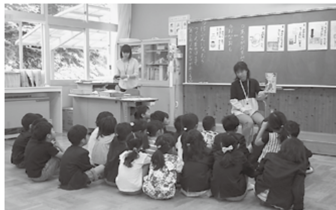
▲読み聞かせボランティア

毎月、小学校・幼稚園・保育園・こども園で絵本の読み聞かせをおこなっています。令和元年度も先生とボランティアの方との打合せをし、子どもたちに楽しく絵本に親しんでもらえるよう、工夫しながらすすめています。本を読むことが好きな方、子どもが好きな方などご協力いただける方をお待ちしています。