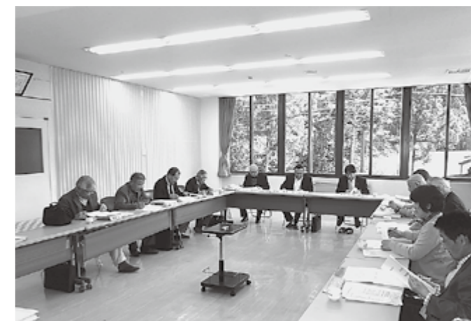
▲農業委員会のようす