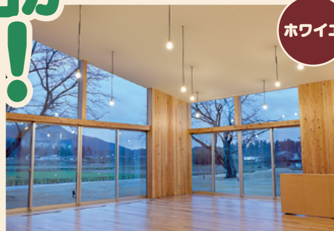
田んぼや鈴鹿山脈が見える明るい空間です。ホール利用時には待合スペースとして利用できます。