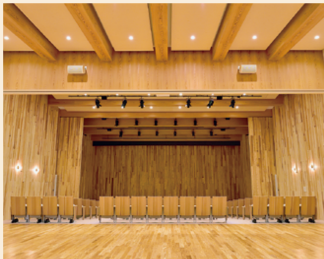
約120席の固定席の「ホール1」、約200席の移動観覧席が収納されている「ホール2」があり、あわせて約300席のホールです。