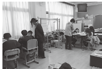
▲優しく見守っていただきました

ボランティアの方は宿題をする児童に、「あと少しですね」「終わったら一緒に遊びましょう」など、声をかけながら楽しく過ごせるよう配慮してくださいました。