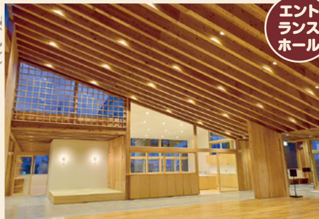
誰でも自由に入れる共有部です。土間ホールにはさまざまな部屋や場所が面しており、たくさんの活動が見えます。