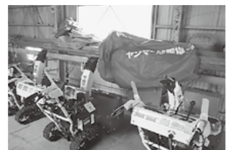
▲簡易に操作できる小型除雪機

貢献広報事業として、地域社会の発展や住民福祉の向上に寄与するためにおこなう事業です。