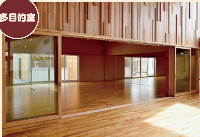
レクチャーや集会の他、軽い運動やヨガなど幅広い目的で利用できます(壁面に鏡が設置されています)。