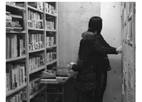
▲たくさんの方にお手伝いいただきました