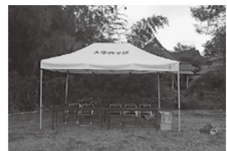
▲少人数で設営できる簡易テント

貢献広報事業として、地域社会の発展や住民福祉の向上に寄与するためにおこなう事業です。