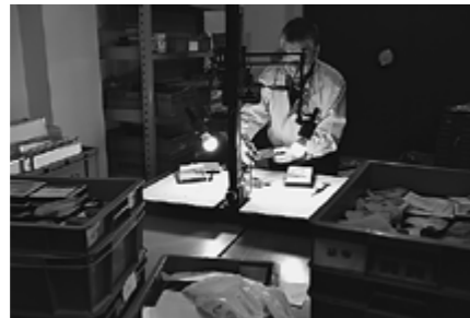
▲化石の調査をしているところです