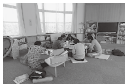
▲修繕作業のようす

破れている本もありましたが、園児が気持ちよく絵本にふれることができるよう整備していただいています。