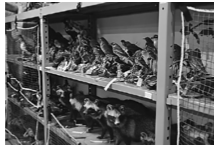
▲約550点のはく製が所蔵されています