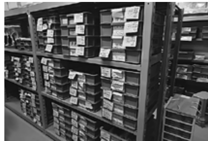
▲棚一面に化石が入ったケースが並んでいます

皆さんは博物館の裏側をご存じですか？ 展示スペースで展示しているものだけが博物館が所蔵しているものすべてではありません(むしろ展示しているものはほんの一部)。今回はそんな博物館の裏側をほんの少し写真でご紹介します。