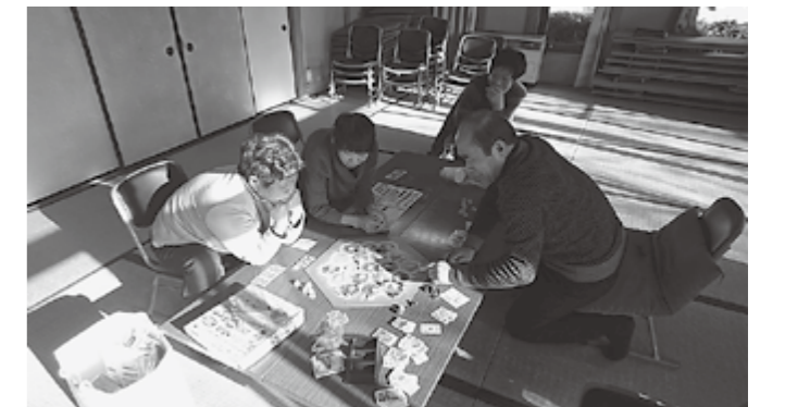
▲カタンを皆さんと楽しみました

集落の高齢者の方々が集まるきっかけになればと思い、ドイツ生まれの私の大好きなボードゲーム「カタン」を集落の皆さんとおこなうイベントを企画しました。集落の方々にお声がけしたところ、皆さん快く参加してくださいました。集まってもらった方の中には、大いに気に入ってくれた方もおられました。また後日開催したいと思います。