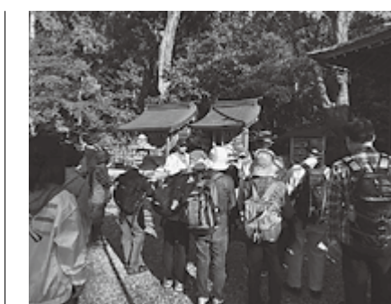
▲大勢の方が参加してくださいました

をふんだんに使用したお弁当を参加された皆さんに召し上がっていただきました。「素朴な味で美味しい」「多賀にんじんのおはぎがとてもおいしかった」「家に帰って作ってみます」など、たいへん好評でした。 紅葉は色づき始めて、赤と緑のコントラストがたいへん美しかったです。