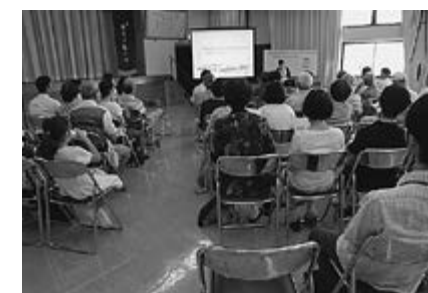
▲第1回説明会(7月15日)のようす