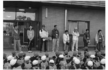
▲お世話になったボランティアの皆さん

参加されたボランティアさんからは「子どもたちから元気をいただきました」などの感想をいただきました。