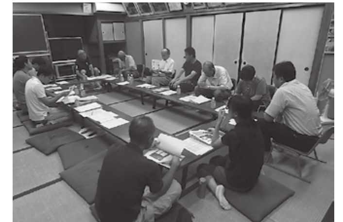
▲むらづくり委員会会議

楽市でのお米の販売をおこないました。霜ヶ原区の魅力をみんなにアピールしていこうという気運が高まっており、今後も霜ヶ原区の皆さんと一丸となって、「安らぎの里 霜ヶ原」を目指して活動していきます。