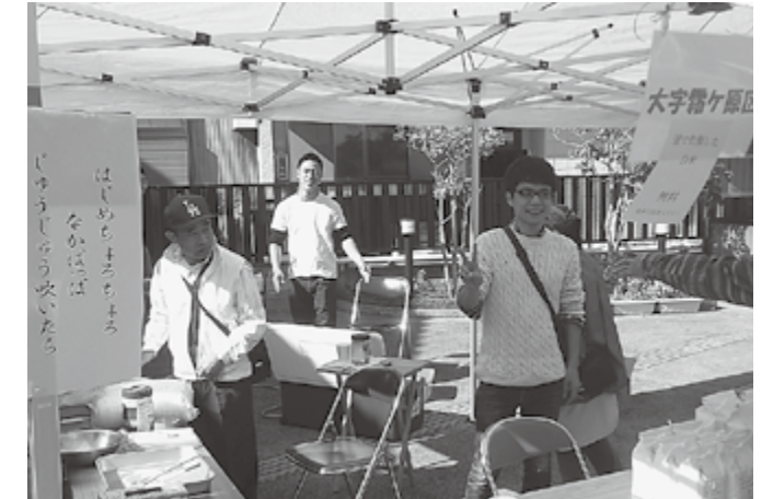
▲みんなで準備中！よい思い出になりました

多賀ふるさと楽市に「霜ヶ原区」として出店しました。心地よい秋空の下、開催されました。設営を終わらせて、いざ開店！ 出品内容は、霜ヶ原でとれたお米で作ったおにぎり。それが飛ぶように売れていきます。また、お釜を使用しての白米の炊き出しパフォーマンスも大好評。昼前にはほとんどの商品が売れました。（もっと用意しておけば……）今回の出店はとても良いものになったと思います。