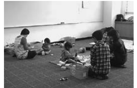
▲就学児健診時の託児

が保育士およびボランティアの方々と一緒にブロック遊びやお絵かきなどをして楽しく遊びました。