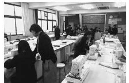
▲ていねいに教えていただきました

生教えてください」と手を挙げる生徒や、ミシン縫いに苦戦している生徒一人ひとりに、ていねいに対応していただきました。