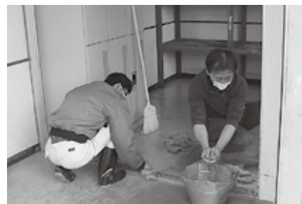
▲整備をしていただきありがとうございました！