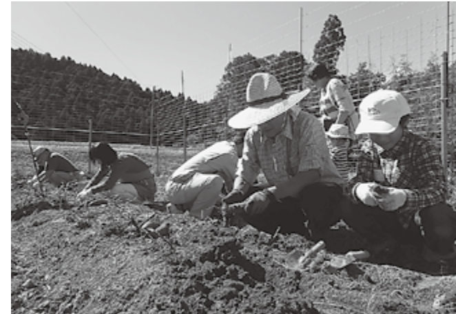
▲芋掘り体験の様子

当日の参加者は多賀町外からは5人。サツマイモ掘り、焼き芋、そしてコンバインでの稲刈りを体験してもらいました。特にコンバイン体験は大好評！ 小さなお子さんは大興奮でした。また体験終了後は、地域の方との交流会で、霜ヶ原でとれたお米を振る舞いました。「このお米おいしいね～！」といったお声を多くいただきました。