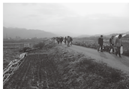
▲清掃活動のようす

人のご参加をいただき、缶やペットボトル、たばこの吸い殻などの散在性ごみを回収することができました。ご参加いただいた皆さん、大変ありがとうございました。これからも多賀町に関わる皆さんで力を合わせ、より住みやすい多賀のまちをつくっていきましょう。