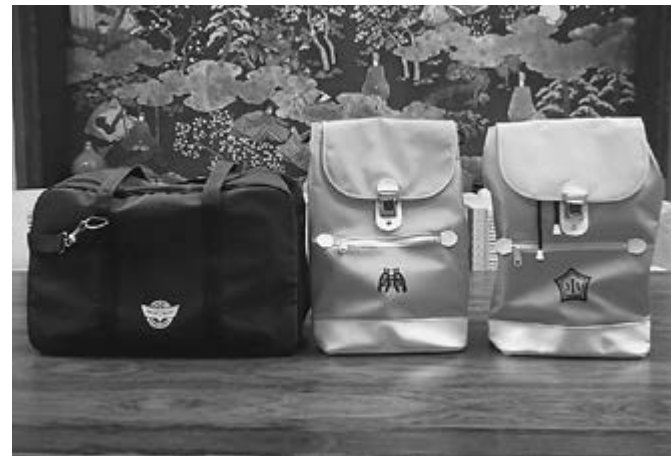
▲スポーツバッグとランリュック

「子育てしやすいまち」として、「将来をになう子どもたち」のために役立ってこれればと願っています。