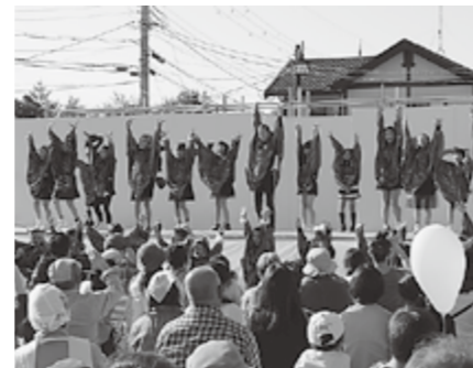
▲やまびこクラブの皆さんのステージ発表