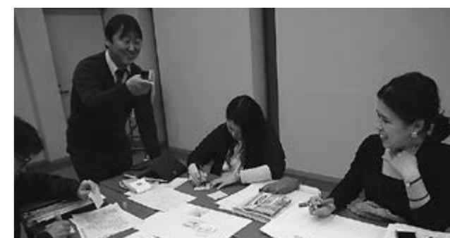
▲新中央公民館でやりたいことを出し合いました