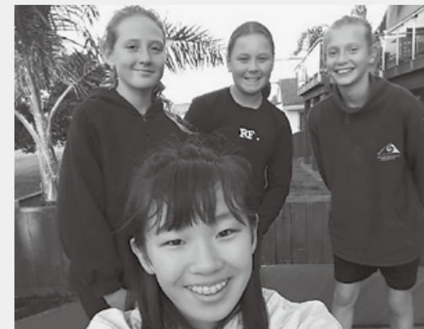
▲ホストファミリーの人たちと

最後に海外研修でお世話になった、多賀町の方々、先生、日本旅行のみなさん、両親、本当にありがとうございました。