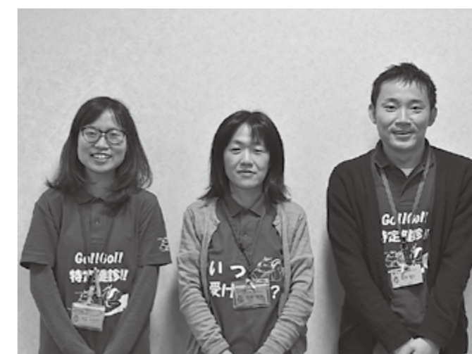
▲私たちに相談ください!

困ったことや心配なことがありましたら、お気軽に「多賀町地域包括支援センター」までご相談ください。