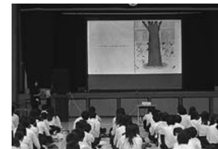
▲読み聞かせのようす

リーンに写し出すという方法でした。短い文章の絵本ですが、生徒たちは静かに聞き入り、主人公まめまめくんから元気をもらえるような作品で、一人ひとりがじっくり考える時間になりました。