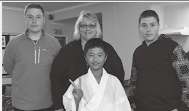
▲ホストファミリーの人たちと