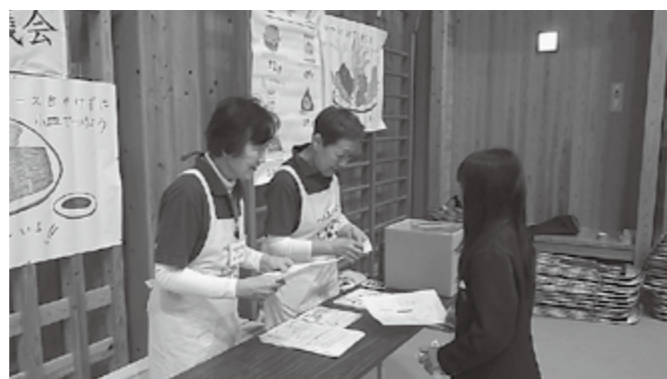
▲食について考えましょう

減塩の啓発、野菜1日350gの啓発など、生活習慣病予防をテーマに各小中学校で、クイズや体験などわかりやすく伝えています。