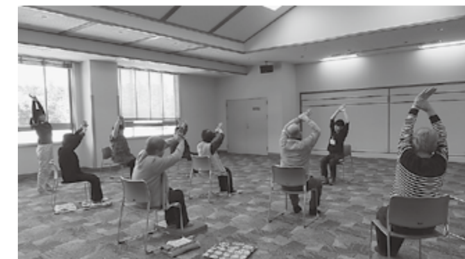
▲体操でフレイルを予防しましょう