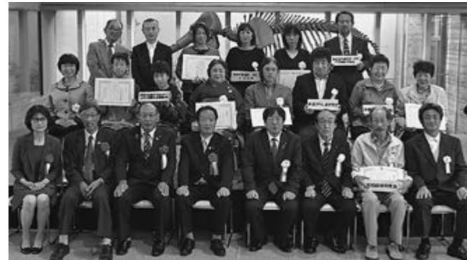
▲表彰を受けられた団体の皆さんと来賓の方々