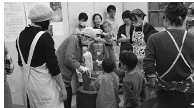
▲味噌づくりのようす