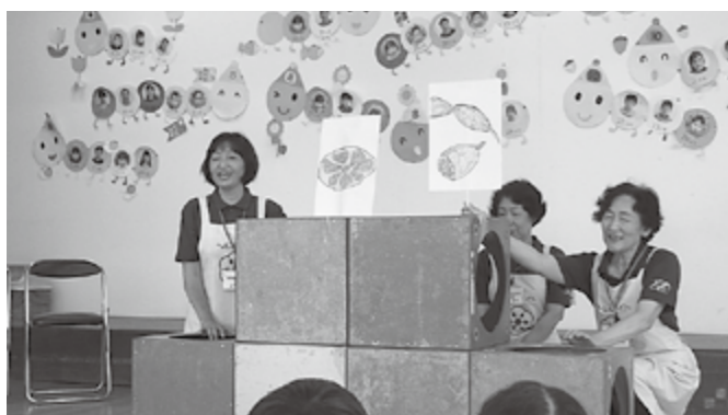
▲保育園での食育活動

子どもたちがわかりやすいように、ペープサート(紙人形劇)や紙芝居などの媒体を使って楽しくわかりやすく、食育の大切さを伝えています。