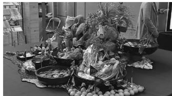
▲多賀町のフードスケープ