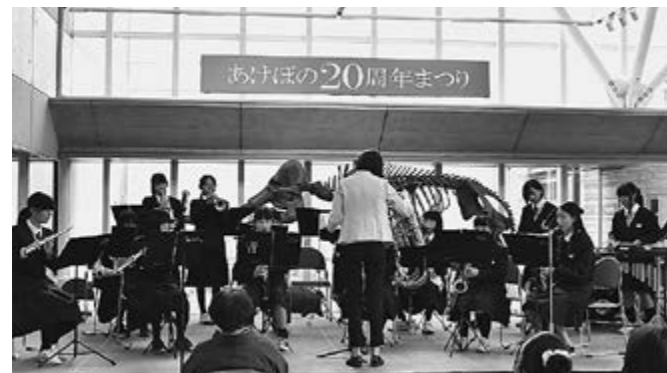
▲多賀中学校吹奏楽部による演奏