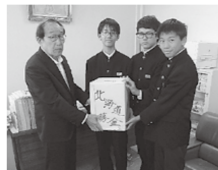
▲教育長への受け渡し

災された方々への義援金として、日本赤十字社に振り込ませていただきました。多賀中生の熱い思いが届くことを願っています。