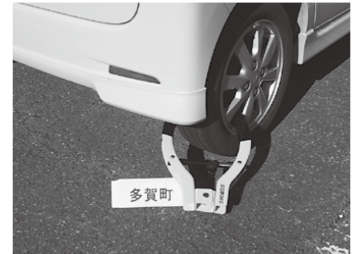
▲差押処分例(自動車にはタイヤロックをおこないます)

町税は私たちが安心して健康な暮らしをするために、重要な役割を持っています。福祉や保険といった社会保障、ごみ処理、教育、道路整備など、さまざまな事業を進めるうえで、非常に大切な財源です。滋賀県下では、毎年増加傾向にある税滞納額の縮小と収納率の向上を目指し、12月を「ストップ滞納!! 強化月間」として、税収確保に努めます。町税の納期限が過ぎても未納の方には、督促状や電話・文書などで催告していますが、納税相談に応じないまま滞納を続ける場合は、税負担の公平性や町民としての負担の義務を果たしていただくため、財産調査をおこなったうえで、財産の差押などの滞納処分を執行します。町税の納め忘れがありましたら、早めに納付してください。