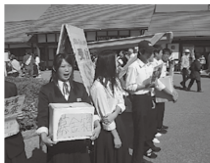
▲募金の取り組みの様子

り総額127,722円が集まりました。10月25日には、生徒会執行部3人が役場に来て、集まった募金を教育長に手渡されました。この募金は、町教育委員会から被