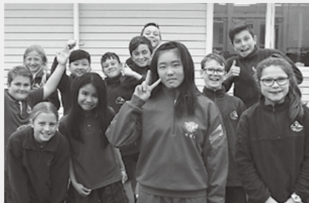
▲クラスメートの人たちと

家では、家族全員がほとんどリビングで過ごしていました。ご飯も全員で食べていたので、良いなと思いました。ご飯は