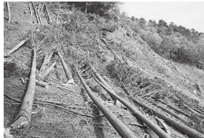
▲中央公民館用木材伐採の様子

多賀町の面積の約86%は森林です。木材は町内でもっとも大きな資源といえるのではないのでしょうか。4月オープンの新しい中央公民館は木造建築であり、多賀町産の木材をたくさん使う努力をおこなってきました。平成27年度から大滝地区を中心に中央公民館建設のための伐採搬出が盛んにおこなわれています。現場は佐目、藤瀬、富之尾、仏ヶ後、萱原と多くの箇所にあたります。運び出された丸太の量はおよそ1,500立方メートルほどです。これは一般