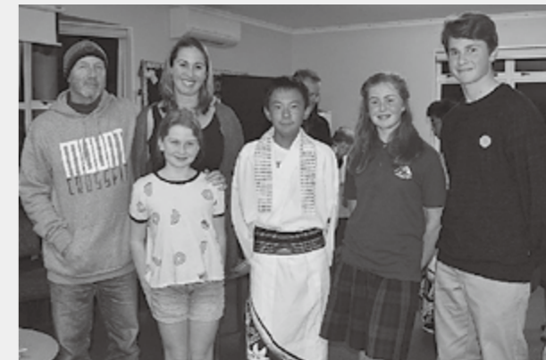
▲ホストファミリーの人たちと

今回の海外派遣研修では、文化の違いや、英語での生活を学ぶことができました。この経験を活かしてこれからの英語の勉強を頑張りたいです。このような貴重な体験をさせて頂きありがとうございました。