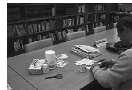
▲細かな作業もていねいにしていただきました

いろいろな作業を手伝っていただきました。図書館応援団にご参加いただいた皆さん、本当にありがとうございました。