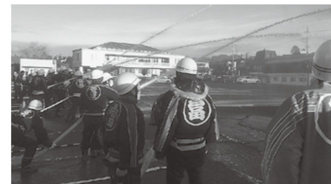
▲消防出初式放水の様子