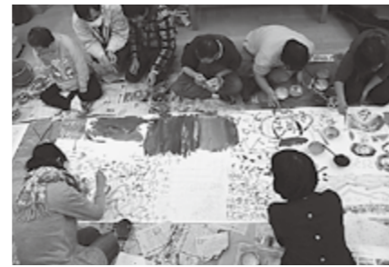
▲自由に描きました

ことができ、またものづくりに活かせるという実感を持つこともできたようです。今後はこの作品をデータ化して、デザインのモチーフとなるものを探し、次の作品につなげていくことを考えています。この取り組みを通して、どんな作品や製品・商品が生まれてくるのかとても楽しみです。