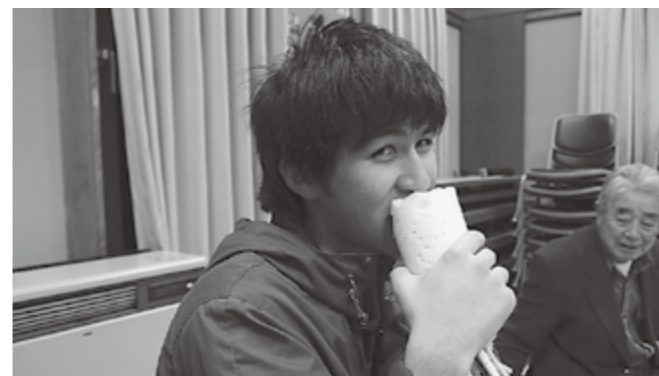
▲神上げ式で生の大根にかぶりつきました

振り返るとあっという間な一年だったなと思います。あと少しですがこれからもがんばっていきたく思います。