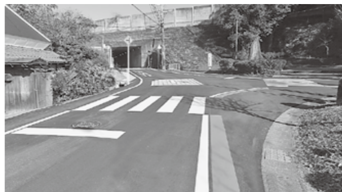
▲横断歩道の引きなおし

地域整備課(道路河川) (有)2-2020 (電)48-8116 (F)48-0157