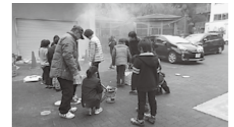
▲七輪でのかき餅焼き

ティアの方から使い方やコツを教わり楽しく学びました。「おじいちゃんちで見たことある」「やった。できたー」など感想を述べていました。