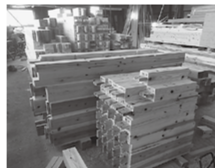
▲木材を使うことにより森林資源の循環をはかります

税務住民課(住民) (有)2-2031 (電)48-8114 (F)48-0594