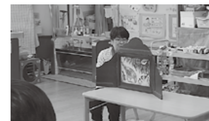
▲多賀ささゆり保育園