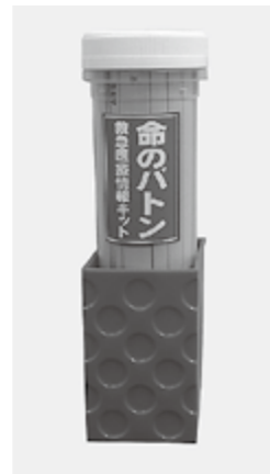
▲救急医療情報キット「命のバトン」

政機関と連携を図りながら、今後も活動を続けていきたいと考えていますので、皆さんのご理解ご協力をよろしくお願いいたします。