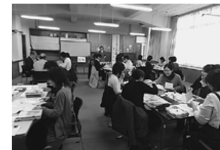
▲グループに分かれて研修しました