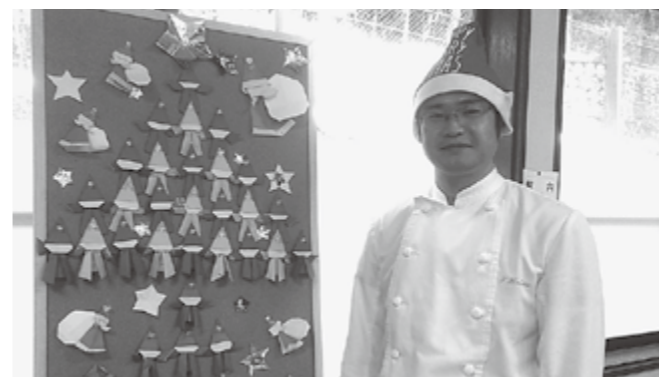
▲サンタの帽子を被ってクリスマスを演出

ただきました。1月7日には、自警団員として多賀町の消防出初式に参加させていただきました。B&G海洋センターでの式典中は、屋内とはいえ足元から凍りつくような寒さがあり、立っただけでも良い訓練になりました。初めて経験するこの冬の寒さに今後も身体を慣らしていきたいと思っています。