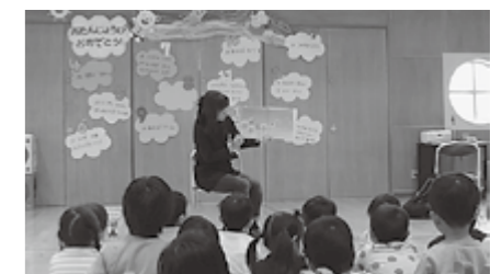
▲たきのみや保育園