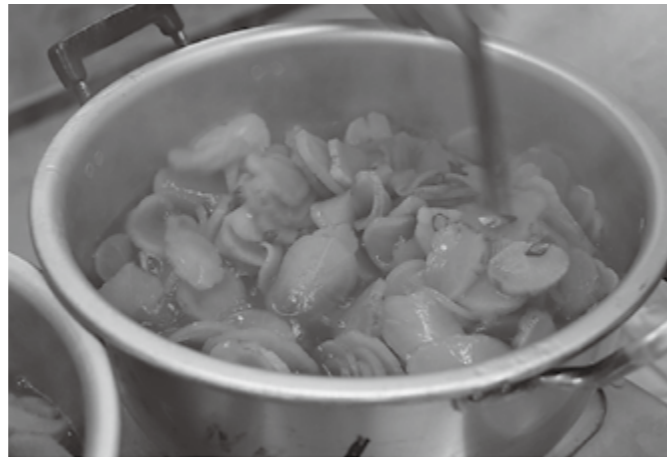
▲皆さんもぜいたく煮を作ってみてくださいね

ントで、また食べたいクセになる美味しさです。このような郷土料理は、画一化された食の真逆、大切にしたいスローフードです。