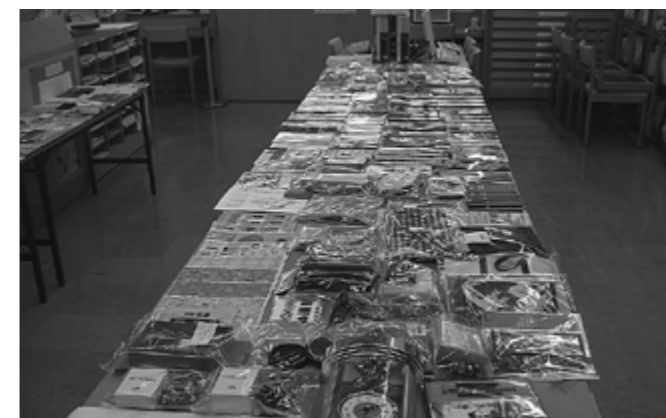
▲たくさん並んだ付録

昨年12月24日に、付録のおわけ会を開催しました。当日は多くの方にお越しいただきましたが、整理券を配布し混乱もなくスムーズにおこなうことができました。