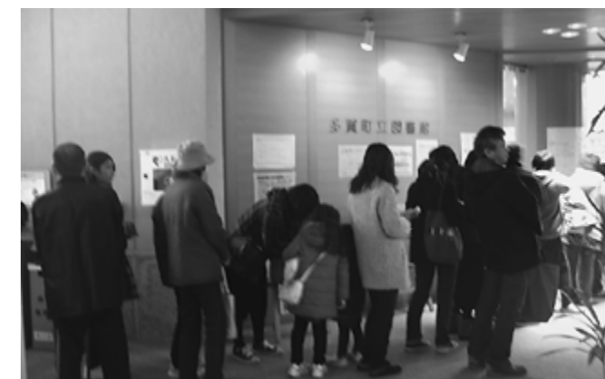
▲多くの方にお越しいただきました