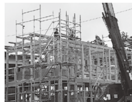
▲完成が楽しみです

口が少しでも拡大し、森林の健全な育成につながることを期待しています。何より、多賀で育った木材のぬくもりと香りに包まれた多賀の暮らしを満喫できる大きなチャンスです。町内で新築をご検討の皆さん、町産木材の