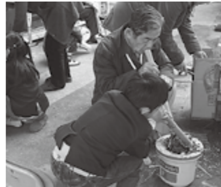
▲昔の人はすごいなあ