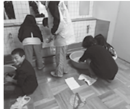
▲途中からコツをつかんでできた