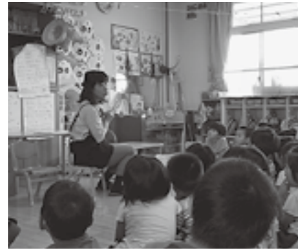
▲多賀ささゆり保育園

います。中には身を乗り出して聞いてくれる子もいて、毎回子どもたちの反応を楽しみにしていただいています。ボランティアの皆さんには、1年間を通してスケジュールを組み、おはなしをしていただき、ありがとうございました。