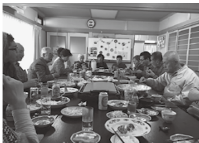
▲みんなでおいただきます

産業環境課(商工観光) (有)2-2012 (電)48-8118 shokan@town.taga.lg.jp