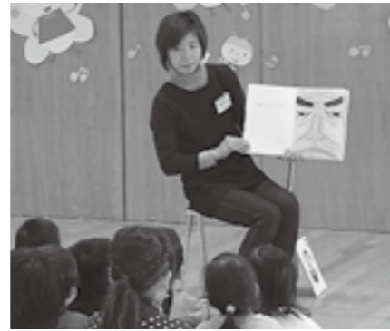
▲たきのみや保育園