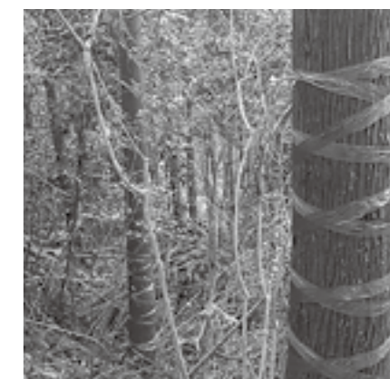
▲テープを巻いたスギ

行うし、木が太いと自分もぐるぐる回らなくてはならないので目がまわってしまいます。たかがテープ巻きですが疲れる作業です。良い木を育てるためにはにはいろいろな作業をしなくてははいけません。そこが林業の面白さなのかなと思います。