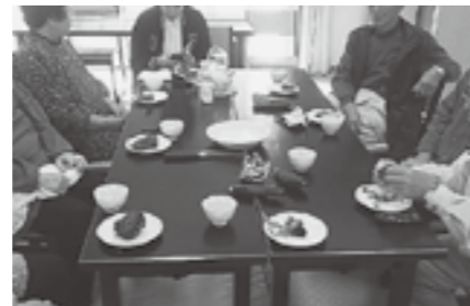
▲まるでスイーツのよう

安納芋の苗を育てたのでホクホクというより、しっとりまるでスイーツのようでした。もちろん水谷の方々と一緒に美味しくいただきました。