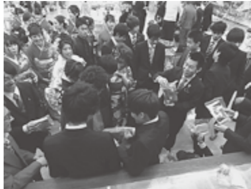
▲タイムカプセル開封