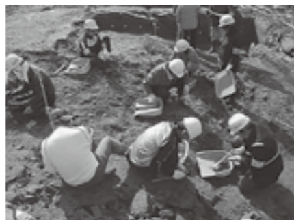
▲今年は何の化石が見つかるかな？