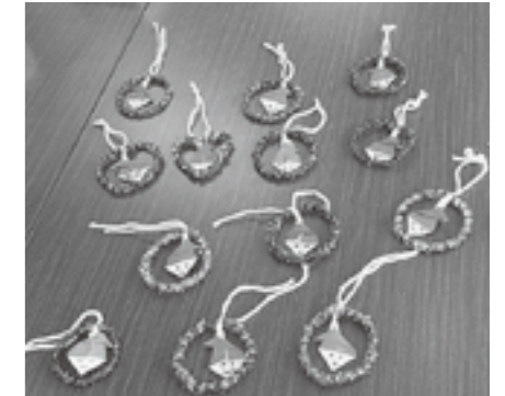
▲サロンで作ったサンタさん

いですね。栗栖のような田舎だとクリスマスはあんまり意識しないのではないかと、という偏見を持っていましたがそんなことはないようです。おじいちゃん、おばあちゃんも皆さん楽しそうでした。