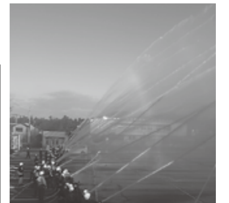
▲迫力のある一斉放水

会し、地域防災の要として、地元の安全、安心のため決意を新たにされました。式典の後は、役場前にて消防ポンプによる一斉放水が行われました。