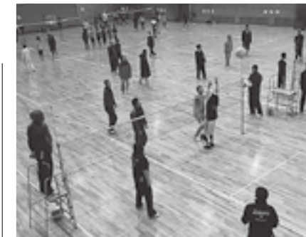
▲昨年の大会のようす

申し込み方法や競技内容などの詳細は、多賀町体育協会事務局(多賀町教育委員会事務局生涯学習課内)までお問い合わせください。