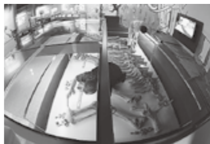
▲展示ケース内の大掃除のようす

休館日でなければできないお仕事が意外とたくさんあるので、なかなか忙しい期間です。今年は2月10日(水)から19日(金)までが整理休館日ですので、お間違えのないようよろしくお願いします。