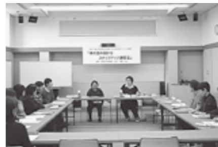
▲本の読み聞かせステップアップ講習会

み聞かせを実演して、日ごろ活動している中で感じていることなどを話し合いました。また、講師の先生からいろいろなアドバイスをいただきました。講習会を受けて、「自信を持って子どもたちに読み聞かせます」「たいへん参考になりました」などの感想をいただきました。今後の皆さんの活動に役立てていただきたいと思います。