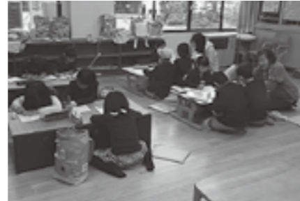
▲児童託児のようす

んだりして、保護者の方を待つ時間を過ごしました。ご協力いただいたボランティアの皆さん、ありがとうございました。