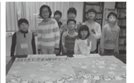
▲巨大年賀状を送りました

私たちは同じ日本という国に住んでいます。今回のような活動を通じて、少しでも復興のお手伝いをしていきたいと思います。