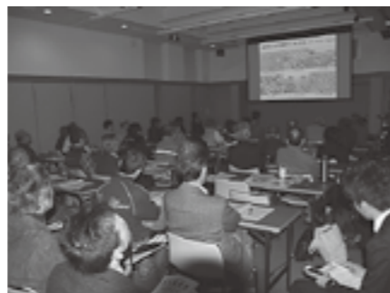
▲昨年の研究発表会のようす