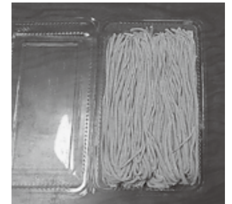
▲きれいに打てました！

りが強かったです。なんでも「新」はおいしいですね。多賀に来なければ、自分でそばを打つことも、新そばを食べることもなかったと思います。彼らが体験できる環境がある多賀にはとても感謝しています。残りわずかとなってきた協力隊ですが、もっとおいしいそばが打てるようがんばります。