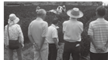
いてみようと考えています。

した。さわやかな甘さで何杯でも飲めます。さらにシソの効能は、アレルギー症状を緩和し、血液をサラサラにするそうです。また、ダイエットにも最適というまさに健康飲料です。比良里山クラブから、シソの種を分けていただきました。今年はその種を水谷にま