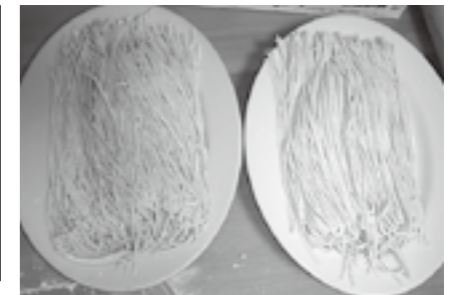
▲自作の手打ちそば

多賀そば手打ち養成塾では、現在1.5kgの二八そばを練習しています。まだまだ未熟者ですが、残りの活動では、自分で打ったそばを今までお世話になった人にお届けしたいと思っています。