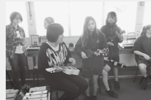
▲ウクレレ演奏に挑戦

初めは、日本と違う環境にとまどって帰りたかったりもしたけれど、最後にはもっといたかったとか帰りたくないかと思ってしまう。また、機会があればホームステイをしたいです。とっても充実した10日間でした。(原文のまま掲載しています)