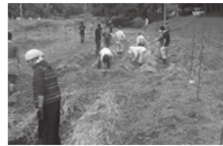
いと思っています。

はこんにゃくに加工して、さしみこんにゃくや煮物にと、集落の方々と美味しくいただきました。こんにゃく芋の栽培を通して、農業の大変さだけではなく、収穫の喜びを学ぶことができました。今年のリベンジの年です。こんにゃくを育てて食べる。それが水谷の文化になるよう取り組んでいきたく