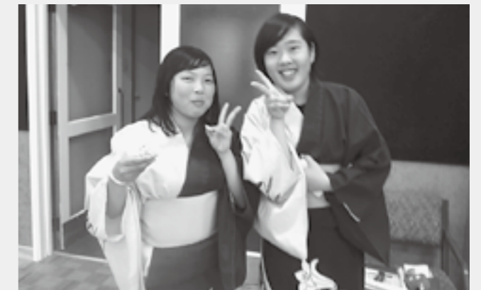
▲多賀音頭をがんばりました

生涯学習課 (有)2-3740 (電)48-8130 s-ed@town.taga.lg.jp