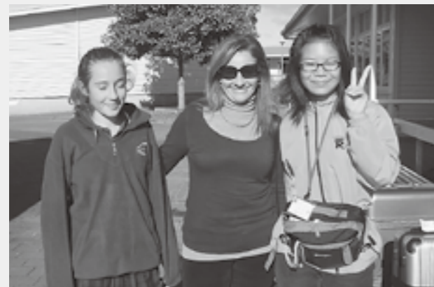
▲スクールで仲良くなりました

この海外派遣研修に参加して、さまざまなことを学びました。ニュージーランドは、困ったこともあったけれど、それ以上にすごく楽しかったです。この研修に参加できて良かったです。(原文のまま掲載しています)