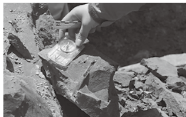
▲第二次発掘調査で発見されたシカの化石

第二次発掘調査では、脊椎動物の化石があると予想される場所を集中的に掘った結果、シカの化石が多く見つかりました。狙った場所からその通りに出てきたことで、さらなる発見への期待が高まります。2014年度は教育普及にも力を入れ、発掘体験を通して、多くの子もたちに化石を調べる楽しさやその意味を伝える機会を設けました。