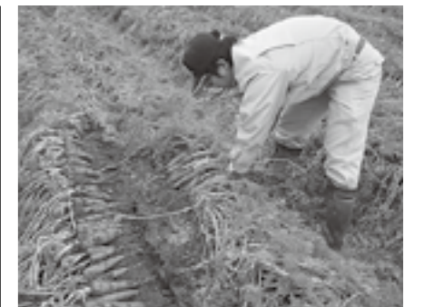
▲多賀にんじん掘り起こし

作業は、にんじん専用の機械で行います。特に、選別機は重さで瞬時にサイズを選別するので、とても画期的だと思いました。箱詰め作業では、にんじんの形を目で見て判断します。真っすぐなもの、曲がっているもの。機械化されたものの、まだまだ人の手は必要不可欠であると感じました。