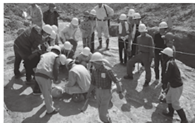
▲第二次発掘調査1日目のようす