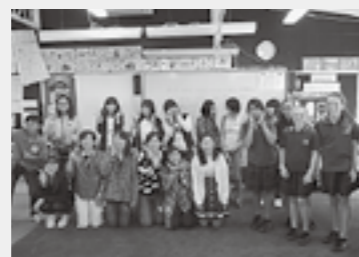
▲みんなと仲良くなりました

8月7日、とうとうホストファミリーとのお別れの時がやって来ました。初めは英語を上手に聞きとれず、日本へ帰りたいたいと思っていましたが、日が