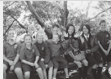
▲マウントマンガヌイカレッジのみんなと