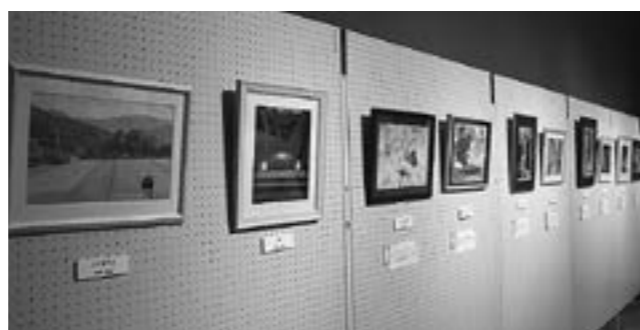
▲昨年の展示のようす