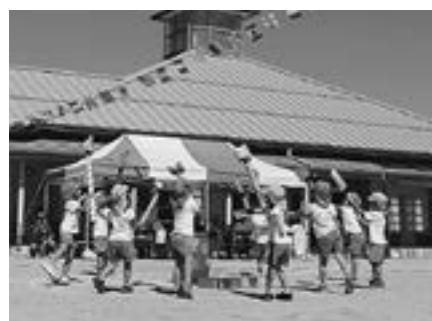
▲たきのみや保育園