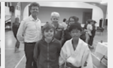
▲ホストファミリーと