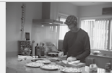
▲お父さんは料理が上手!