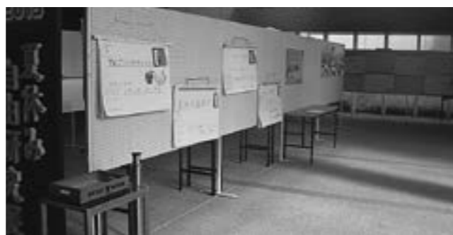
▲自由研究展のようす

あっという間に11月になり、博物館で飼育しているカエルも冬眠する季節になりました。みんなが見てくれる人気者になったこのカエルはシュレーゲルアオガエルと言って、オタマジャクシのころからずっと飼い続けていま