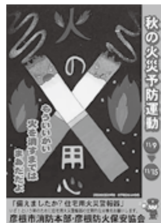
▲彦根市消防長賞作品

※秋の火災予防運動ポスターに採用し、彦根防火保安協会会長賞作品は、春の火災予防運動ポスターに採用する予定です。