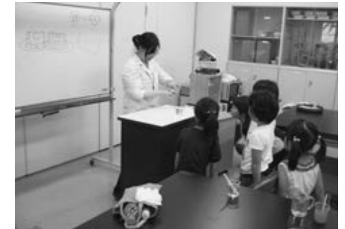
▲水を使った実験のようす