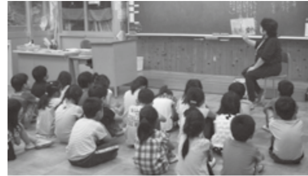
▲多賀小学校での読み聞かせのようす

びや練習など、大変なこともあります。朝の10分という限られた時間の中で、子どもたちに絵本を通じて触れ合えることを楽しみにしています。