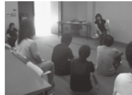
▲お話を楽しむ受講者の皆さん

手で、聞き手になることが少ない受講者の皆さんは、お話を聞く楽しさを改めて感じておられたようすでした。受講生の皆さんがこの研修会で学んだことを活かし、子どもや地域の方々に素晴らしい本との出会いを届けていただけたらと思います。