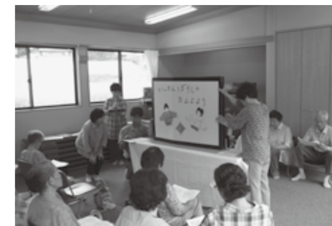
▲一寸法師の紙芝居にて

私の住んでいる家の裏が山ということで、家の周りをお猿さんで包囲されることも多々あります。ロケット花火で追い払うのも慣れてきました。