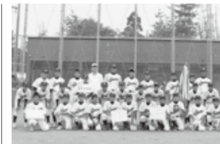
▲優勝された稲枝中学校の皆さん