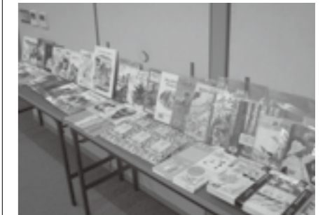
▲おすすめの絵本の紹介

総務課(人権推進) (有)2-2001 (電)48-8121 soumu@town.taga.lg.jp