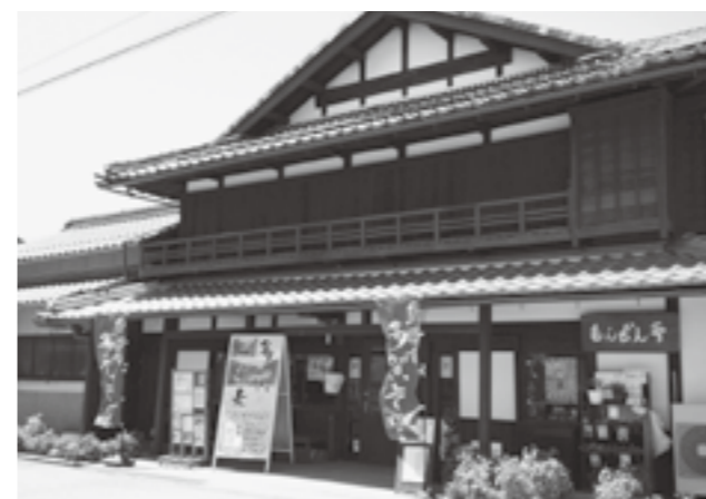
▲多賀そば工房にて

梅雨も明け、暑い日が続いていますね。世間では事件や事故のニュースがひっきりなしに入ってくる今日このごろ。栗栖地区を中心に活動をさせていただいています。田んぼや畑の草刈り、サロンの参加、ハウスでのトマト栽培や野菜栽培のお手伝い、下草刈りなど。その中で、今回は2つの活動について紹介したいと思います。ひとつは、もんぜん亭での「多賀そば工房」のお手伝いです。毎週土曜日、多賀そば手打ち養成塾生による手打ちの多賀そばを提供しています。私は定食メニューの炊き込みご飯の仕込み、そば薬味の仕込み、注文を聞いてそばを提供する作業を行っています。町長をはじめ、役場の方、町民の方、町外からの方など、さまざまな方にお越しいただいて、連日大盛況です。お客さんとの何気ない会話から、同じ新潟県出身だと分かたり、私の活動を応援していただいたりと、人と会話することの大切さを感じて