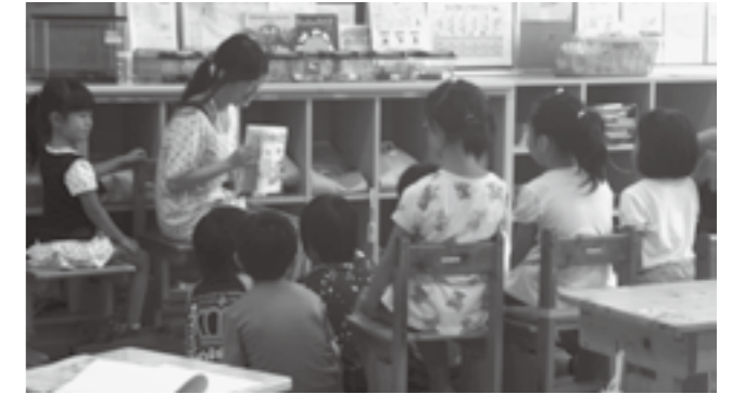
▲大滝小学校での読み聞かせのようす