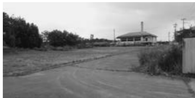
▲キリンビール社宅跡地