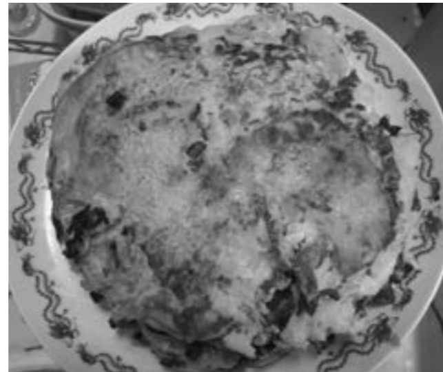
▲野菜たっぷり! 「たがおこ」

岡山県日生というところの地元B級グルメに、牡蠣を使ったお好み焼きで、「かきおこ」というのがありました。この野菜お好み焼きは、ニンジンの特産地でもある多賀から「たがおこ」です。栄養面からいえば、B級どころか立派なA級だと思のですが、このアイデアはいかがなものでしょうか。