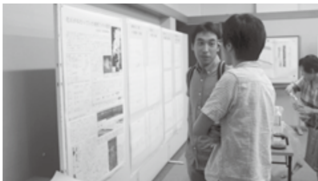
▲成果報告会のようす