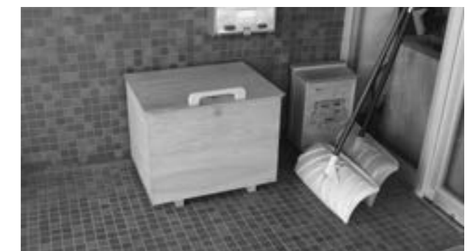
▶多賀区福祉会館での設置のようす