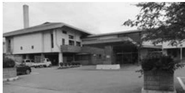
▲現在の多賀町中央公民館

建て替え場所の選定については、非常に重要な問題であることから、多賀町議会議員の皆さんにもていねいな説明を重ね、理解を求めてきました。その選定理由は次のとおりです。