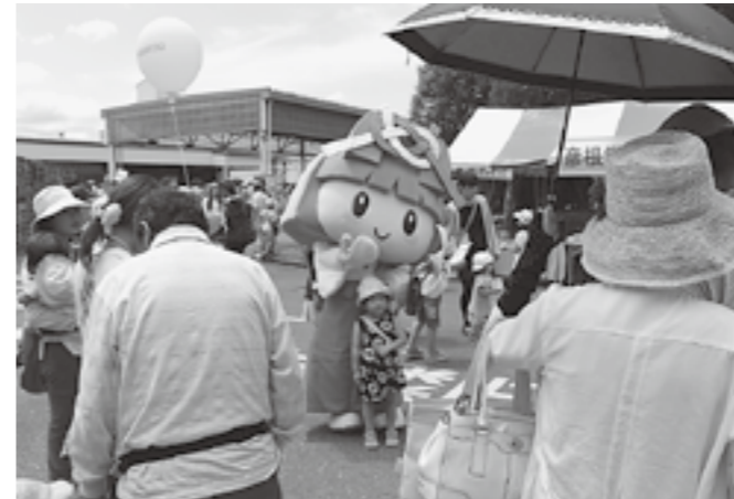
▲たがゆいちゃん登場!

しめるイベントであったと思います。このようなイベントが今後も開催され、地域活性化につながればと考えます。