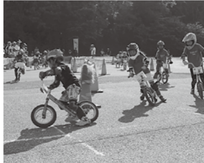
▲カーブを曲がる選手