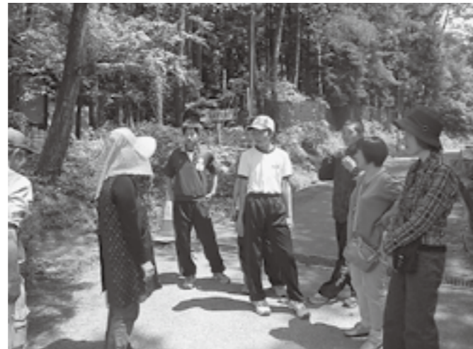
▲真剣なまなざしです