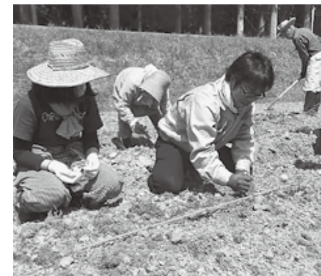
▲こんにやく芋植えにて