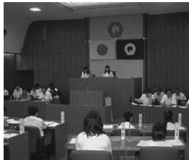
▲平成25年度「多賀町子ども議会」の様子