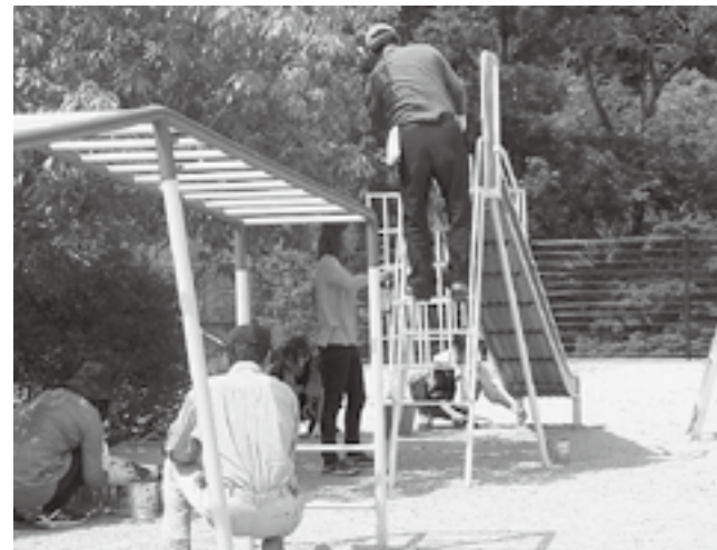
▲ペンキ塗りのようす

5月25日にたきのみや保育園の愛園作業で、遊具のペンキ塗りのお手伝いをしました。晴天の中、保護者の皆さんと一緒に、鏝を落としたり、遊具の塗り直しをした