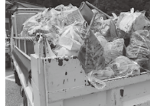
▲ゴミゼロを目指して

達成感はありませんが、ゴミを捨てる人がいなくなれば、清掃活動をする必要はないですね。今回のような清掃活動を粘り強く続けることで、心も環境もきれいな町づくりにつながっていくことを信じています。