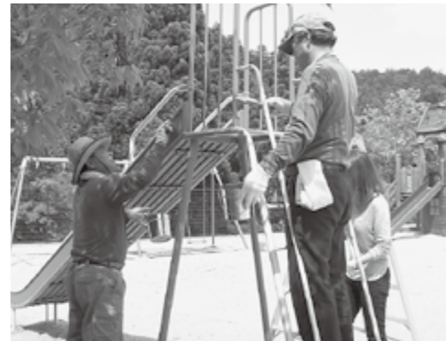
▲カラフルになるすべり台

りました。明るい色に塗り替えられた遊具で、園児たちが遊んでくれることを楽しみにしています。