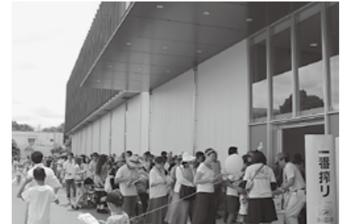
▲工場見学は大盛況!