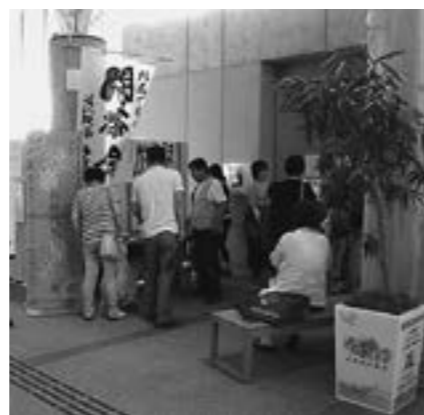
▲昨年の闘茶会の様子

B&G海洋センター (有)2-1625 (電)48-1625 b-g@town.taga.lg.jp 生涯学習課 (有)2-3740 (電)48-8130