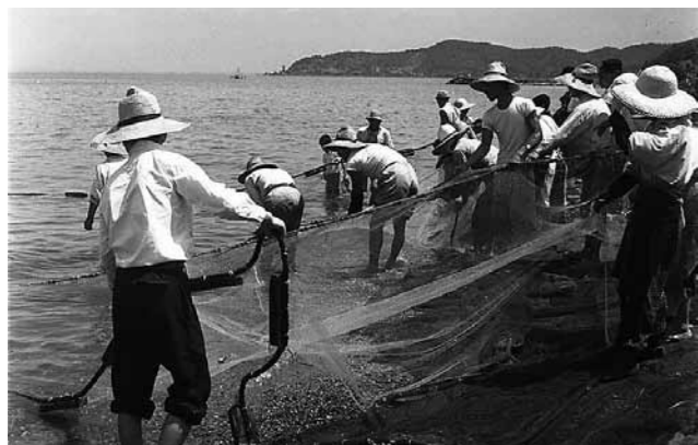
▲昭和30年代 地引網で小鮒を引きあげる

お問い合わせ 多賀町立文化財センター事務局 (電)48-0348 bunkazai@town.taga.lg.jp