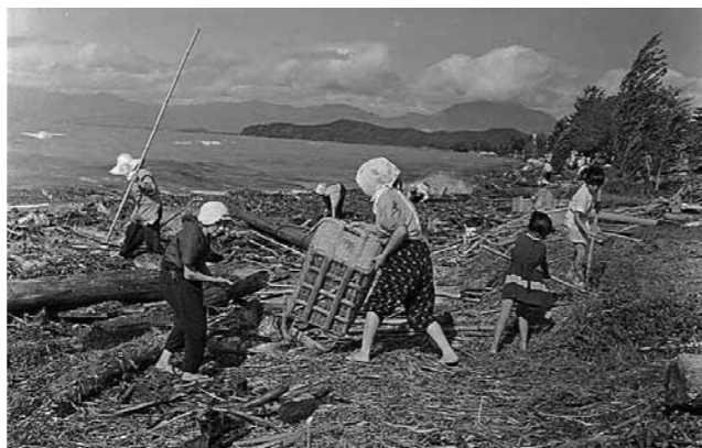
▲昭和34年9月 伊勢湾台風の後