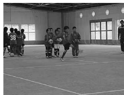
▲多賀ジュニアフットボールクラブスポーツ少年団

活動に関する詳細は、小学校・幼稚園・保育園に配付するチラシ、または、多賀町スポーツ少年団事務局(多賀町B&G海洋センター内)までお問い合わせください。