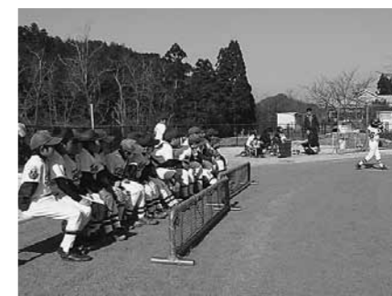
▲多賀少年野球クラブスポーツ少年団