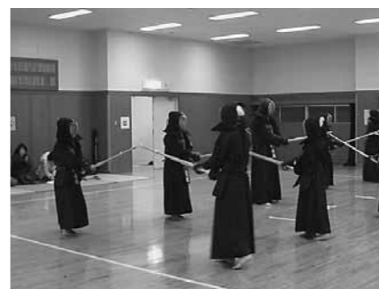
▲多賀剣道部スポーツ少年団

今年「大滝柔道少年団」が、東京オリンピックの開催された1964(昭和39)年に「大滝柔道スポーツ少年団」と改称して50年という輝かしい節目を迎えます。6年後には、また東京でオリンピックが開催されるなど、スポーツ界は大きな注目を集めています。