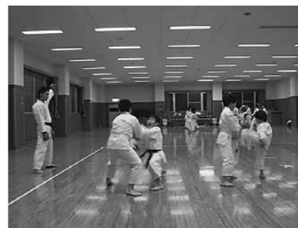
▲日本正剛館空手道湖東多賀スポーツ少年団