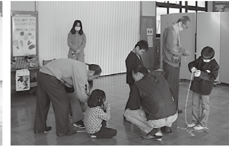
▲コツを教えてくださいました