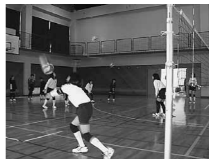
▲多賀Kidsバレーボールスポーツ少年団