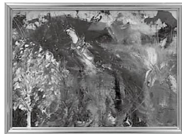
中学生秀作賞■「色」 北川 珠声