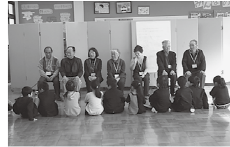
▲よろしくお願いします!

1月23日の学習参観時に、1年生の生活科で、こま回し・けん玉・お手玉・あやとりなどの昔の遊びを、ボランティアの方に教えていただきました。