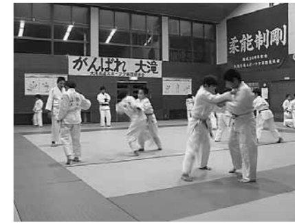
▲大滝柔道スポーツ少年団