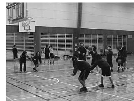
▲TAGAミニバスケットボールスポーツ少年団