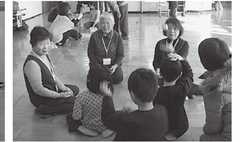
▲楽しいふれあいの時間でした

グループに分かれて、保護者の方も一緒に、昔懐かしい(子どもたちにとっては新鮮な)遊びに夢中になり、楽しい時間を過ごしました。