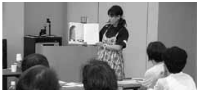
▲読み聞かせの実演