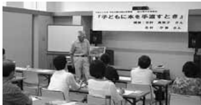
▲読み聞かせの実演