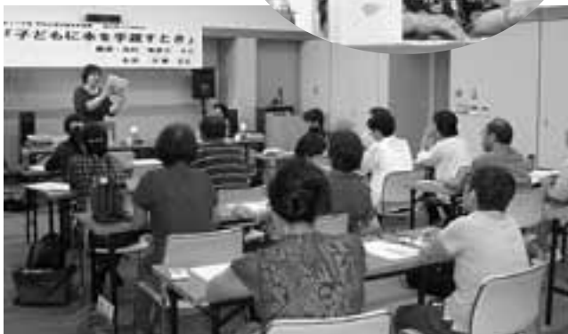
▲熱心に話を聞かれる受講者の皆さん