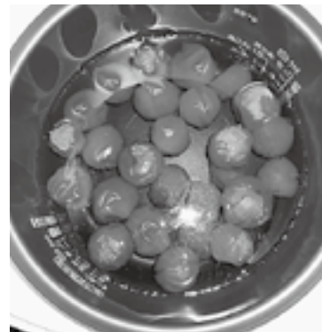
▲梅ジュースを作りました!

緑のふるさと協力隊の私の日々の活動はブログで発信しています。下記のアドレスからご覧ください。