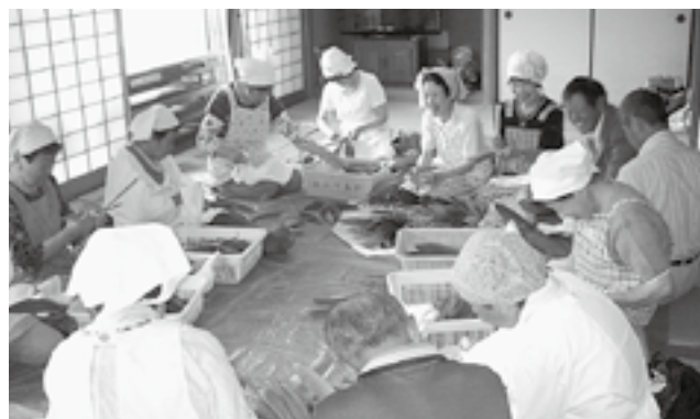
▲ちまき作りのようす

笹の葉もイグサも地域の方々への協力なしには準備することができません。笹が山から姿を消してしまわないように、また、この伝統的な「ちまき作り」を若い人たちに伝え、後世に残していただきたいと思います。