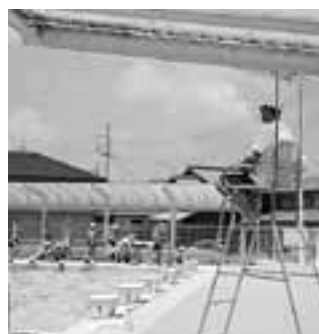
▲多賀小プールでの監視の様子