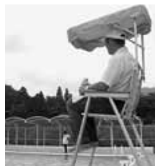
▲滝の宮プールでの監視の様子