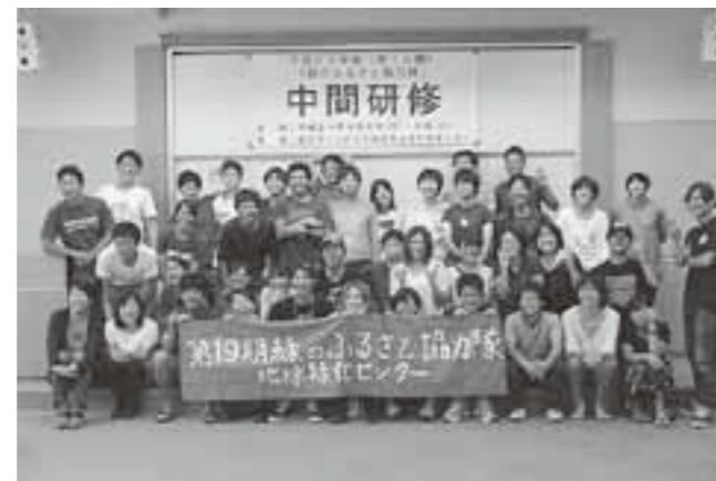
▲19期 緑のふるさと協力隊

東京で緑のふるさと協力隊中間研修がありました! 協力隊目線でみたさまざまな集落の現状や、同期の活動状況などを聞いて良い研修になりました♪