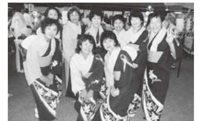
▲オレンジリボンを付けて万灯祭へ参加

そして、育児の悩みや不安など…どうぞお気軽に地域の民生委員児童委員にご相談ください。プライバシーは堅く守りますのでご安心ください。