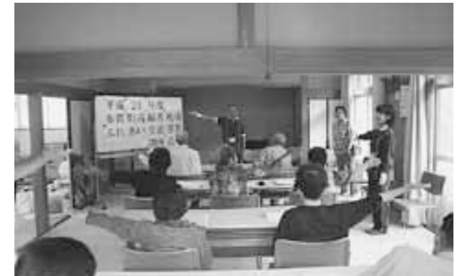
▲ストレッチ体操の風景

大滝方面にお住まいの方がメインとなりますが、興味を持たれた方は福祉保健課までお問い合わせください。