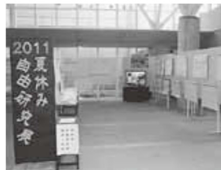
▲昨年の展示のようす