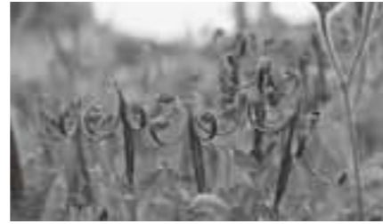
▲ゲンノショウコ

集合場所■多賀町立博物館駐車場 (9時30分集合) 参加費■100円(傷害保険料)