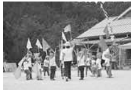
▲たきのみや保育園