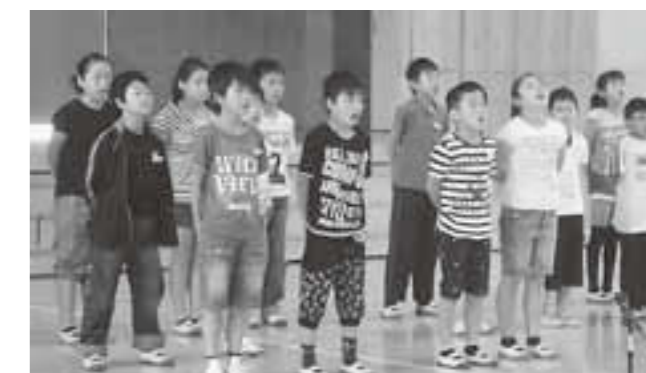
▲大滝小学校5、6年生の皆さん 「群読」

教育総務課 (有)2-3741 (電)48-8123 k-ed@town.taga.lg.jp