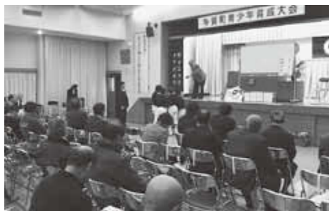
▲昨年の育成大会のようす

今年も多くの町民の皆様にご参加いただきまして、これからの多賀町を担う子どもたちに熱いご支援を賜りたく存じます。