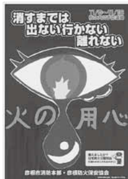
▲彦根市消防長賞でつくられた秋の火災予防運動ポスター

子ども・家庭応援センター (有)2-8137 (電)48-8137 kodomo@town.taga.lg.jp