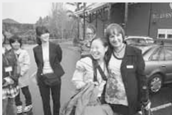
▲ホストマザーのお出迎え