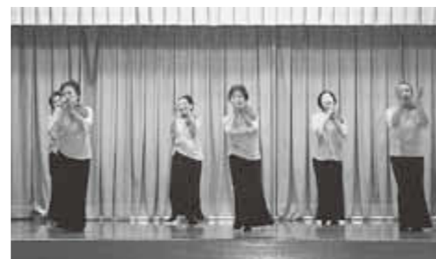
▲サイン・ドールズの皆さん 「手話ダンス」