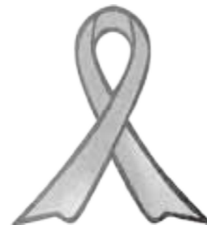
※オレンジリボンは、「子ども虐待防止」という願いが込められています。