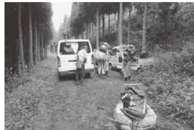
▲山林組合での作業

考えてみると、こっちにきて毎月のように東京から友だちが遊びに来て来てくれています! すでに2回遊びに来てくれている友だちも数人いますし、ひと月の間に2回遊びに来た強者もいます! みんな最初は「凄いとこに住んでるな!」とか言っていますが、帰るころには「ほんと良いところだ! 景色も綺麗だし人も温かいし、また来るわ!」と言ってくれます♪ やはり多賀町は凄く魅力的な町なんだなーいつも思います♪ ちなみに10月も11月も