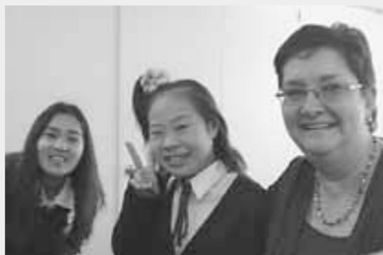
▲先生のクルーガー、ホストシスターのワーちゃんと

税務住民課(税務) (有)2-2041 (電)48-8113 zei@town.taga.lg.jp