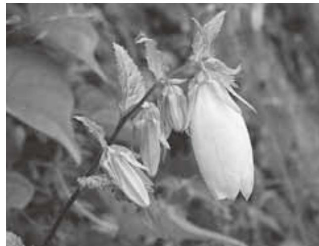
▲ホタルブクロの花