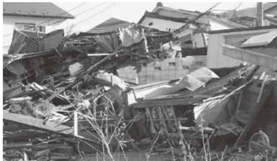
▲震災により倒壊した家屋

私たちが住む滋賀県も琵琶湖西岸断層など複数の断層があり、いつ大地震が発生してもおかしくない状況