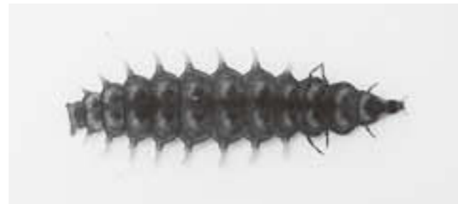
▲ゲンジボタルの幼虫。ホタルの成虫とは似ても似つかぬ姿をしており、川の中の巻貝(カワニナ)を食べます。

皆さんはホタルの歌をご存じですか?この歌の中には「こっちの水は甘いぞ…」と水について歌われている部分があります。ホタルは水辺の生きものという印象が強いかもしれませんが、その一生のうち水中で過ごす時期のある種類は実はほんの一握りなのです。日本に生息しているホタルの仲間約50種のなかで、水生の時期があるのは、有名なゲンジボタル、ヘイケボタル、そして沖縄の久米島だけに生息するクメジマボタルの3種だけです。…とはいえ、陸生のホタルたちにとっても生きていくうえで綺麗な水はとても重要なので、ホタルにとっての「甘い水」を維持していきたいですね。