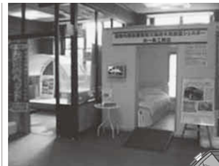
▲耐震シェルター、防災ベッドの展示の様子