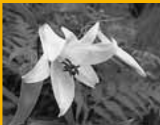
ササユリ [Lilium japonicum]