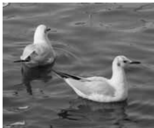
▲ユリカモメの冬羽。水辺でよく見かけます。(写真1)

さて、このユリカモメ、田んぼで何をやっているのかというと、びっくりして出てきた昆虫やミズミズなどを食べています。ちょうどその餌を出し