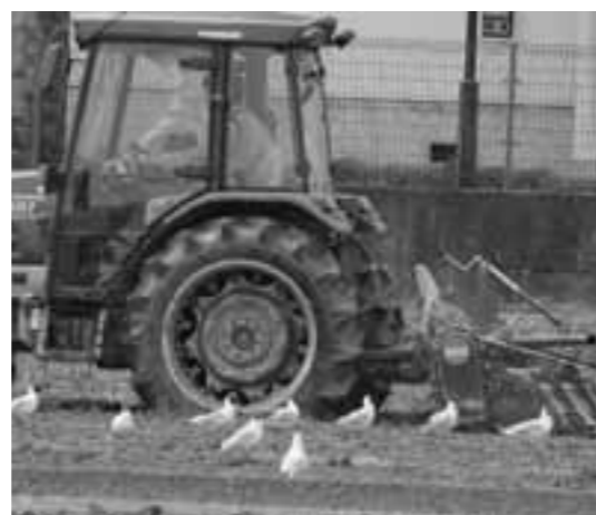
▲トラクターの後ろをみんなであついで歩きます。(写真3)

てくれるのが、作業中のトラクターなのです。ユリカモメにとって、トラクターは餌をくれる存在と認識しているようで、怖がりません(写真3)。見ていると不思議な光景なのですが、まさに人の営みの中でユリカモメが暮らしている姿だと考えています。