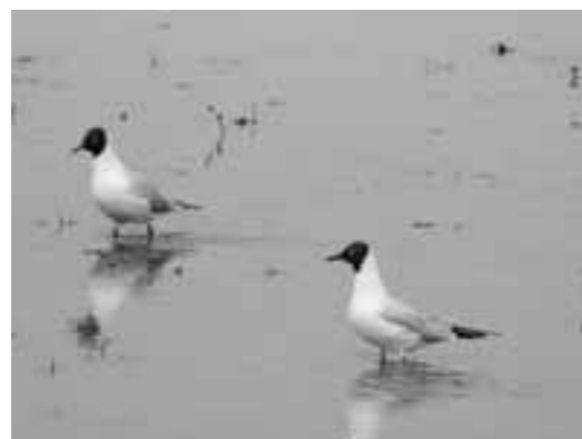
▲ユリカモメの夏羽。あたまたに黒ずきんをかぶっています。(写真2)