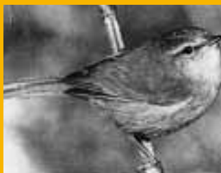
ウグイス [Cettia diphone]