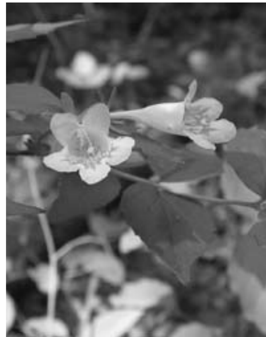
▲ツクバネウツギの花。白い花の中には黄色い網目模様があります。

ツクバネウツギは主に本州、四国、九州に生育する高さ2mほどの落葉低木です。多賀町では山間部でよく見ることができ、毎年4月から6月にかけて花を咲かせます。花は枝の先に白い花がふたつ並んで咲いており、花の形は筒状、そしてその中をよくみると黄色やオレンジ色の網目模様があります。そして花が咲き終わるとプロペラ状の細長い「かく片」が5枚ついた果実ができ、この形が羽根突きの羽に似ていることが名前の由来となっているといわれて