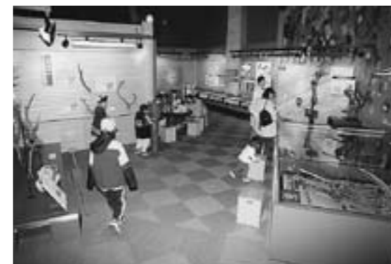
▲開館当初の博物館