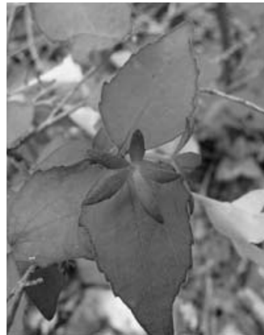
▲ツクバネウツギの実。この5枚のかく片がプロペラの役割をします。