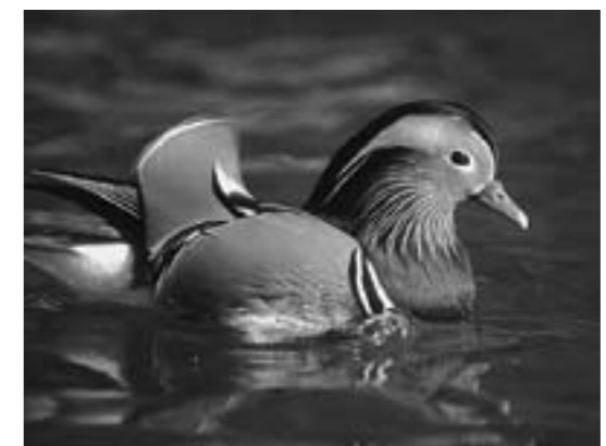
▲オシドリ

オシドリが観察されました。それらの数を集計してみると、多賀町は滋賀県下でも有数のオシドリの生息地であることがわかってきました。このように少しずつですが、多賀町にやってくる水鳥とその特徴が明らかになりつつあります。これからの時期、町内ではいろいろな種類の水鳥を観察することができますので、みなさんもぜひ観察してみてください。