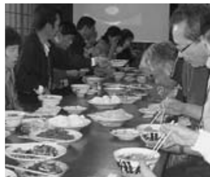
ご協力をいただきました八重練区の皆さま、本当にありがとうございました。