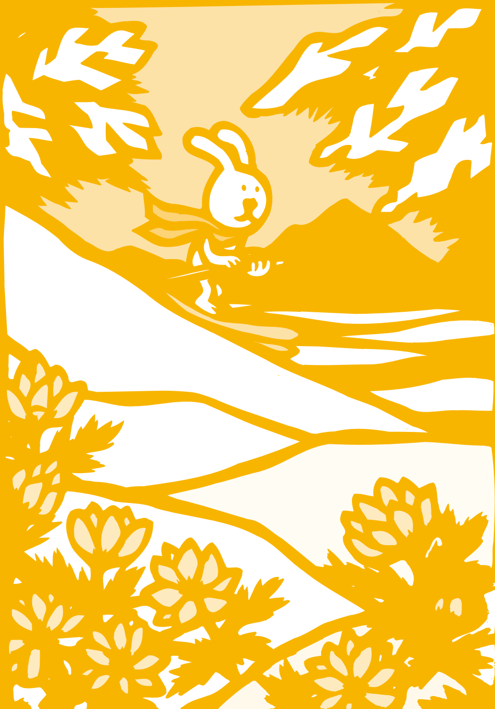
花ごよみ／フクジュソウ(キンポウゲ科)早春の太陽の光を浴びて輝くばかりの黄色の花が咲きます この花の自生を見ることができる場所は限られているので、貴重です