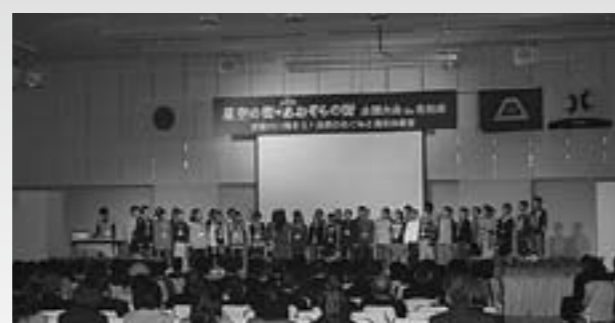
▲小学生による星空観察報告