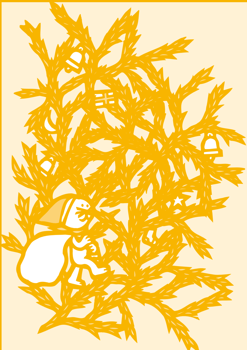
花ごよみ／ヒカゲノカズラ(ヒカゲノカズラ科)シダ類の多年生常緑草で日本各地の明るい山麓に自生しています 天岩戸の前でアメノウズメノ命が身につけ踊ったと伝えられています