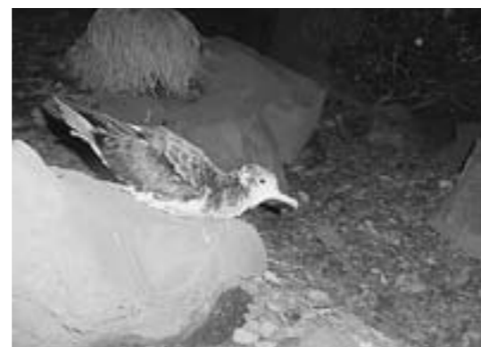
▲明け方に岩場に登り、飛び立つ前のオオミズナギドリ(写真2)