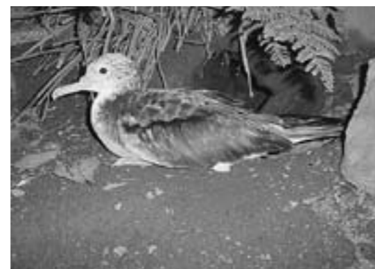
▲京都府の鳥でもあるオオミズナギドリ。奥にあるのが巣穴です(写真1)

オオミズナギドリは夏鳥として日本に飛来し、冬になるとフィリピンやオーストラリアの北部など南の暖かい地方へ移動します。今回確