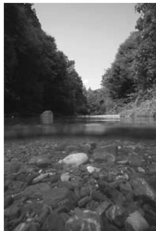
▲カジカが生息している川の様子。川底にはさまざまな大きさの石や砂があり、その中にはいろいろな生きものが生息できる「すきま」があります。