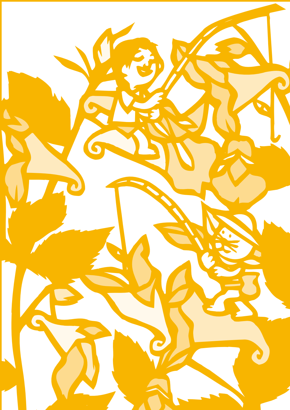
花ごよみ／ツリフネソウ(ツリフネソウ科) 湿地にまとまって咲いている様子は楽しげでうれしくなります 実をさわると、パシッと音がするほど勢いよくはじけて種が飛びます