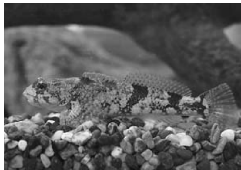
▲ 河川の上流に生息しているカジカ大卵型