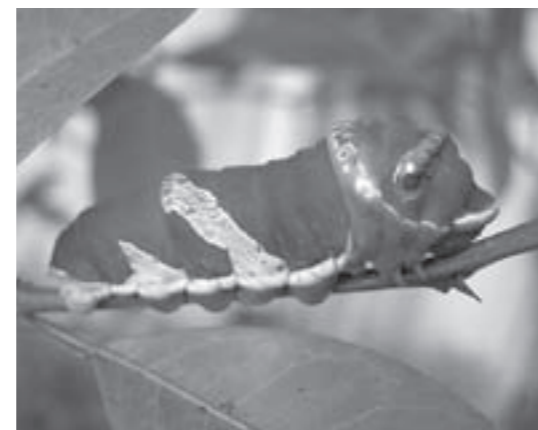
▲ナガサキアゲハの終令幼虫。大滝小学校で見つけました。