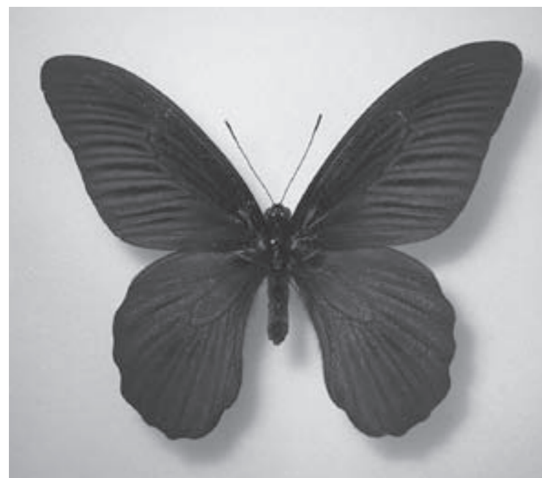
▲多賀町内で最初に採集されたナガサキアゲハ