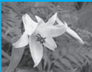
ササユリ [Lilium japonicum]