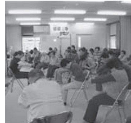
▲敏満寺サロン(11月12日開催)