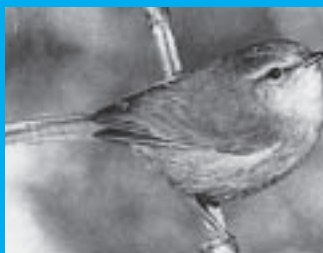
ウグイス [Cettia diphone]