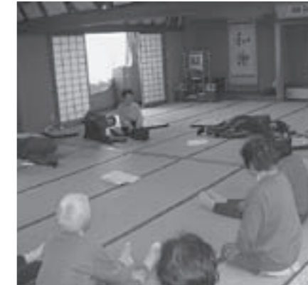
▲佐目サロン(11月15日開催)