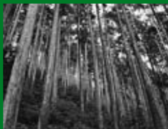
スギ [Cryptomeria japonica]