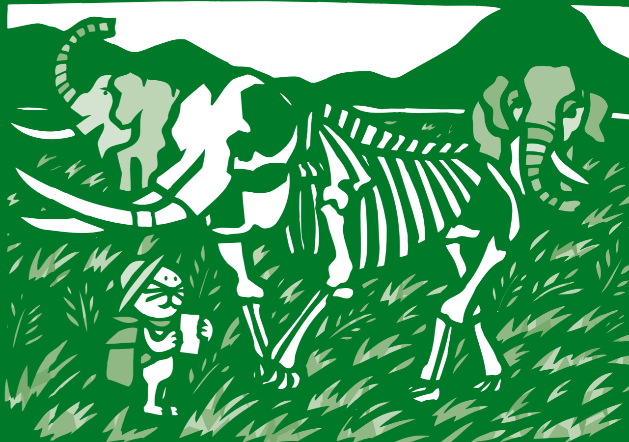
多賀町で発見されたアケボノゾウ化石は博物館に展示されています