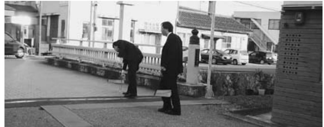
▲毎朝始業前にされているごみ拾い活動

もちろん、毎朝のごみ拾いの活動は継続したいと思っています。さらに、CSR(企業の社会的責任)として、地域に根ざした銀行であるため、地域のイベントや行事などにも、参加していきたいと思っています。「環境を無視した経営は成り立たない」と考えていますので、環境への取り組みはもちろんのこと、地域が栄えてこそ、銀行も成り立ちます。「地域にできることはしていきたい」と考えています。