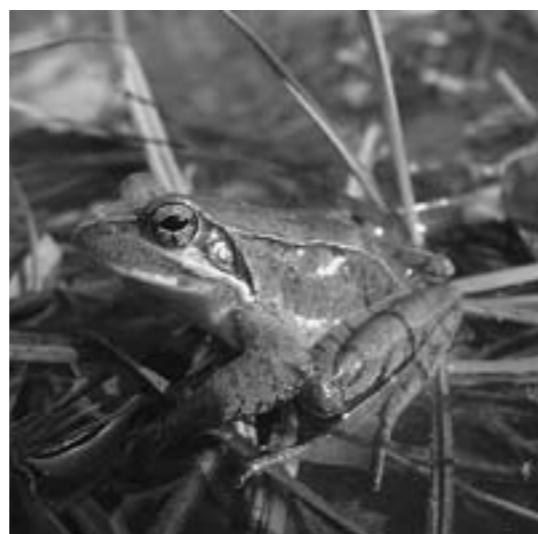
▲田んぼにやってきたニホンアカガエルのオス(写真1)