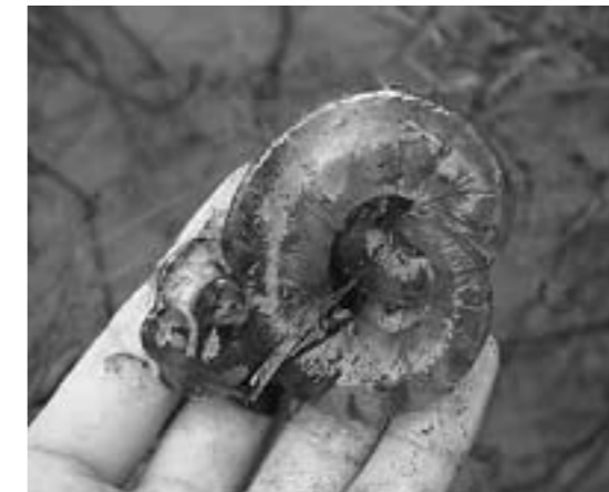
▲カスミサンショウウオの卵塊(らんかい)