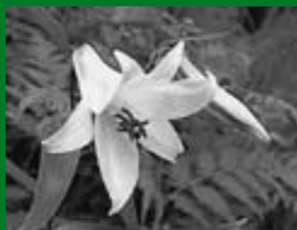
ササユリ [Lilium japonicum]