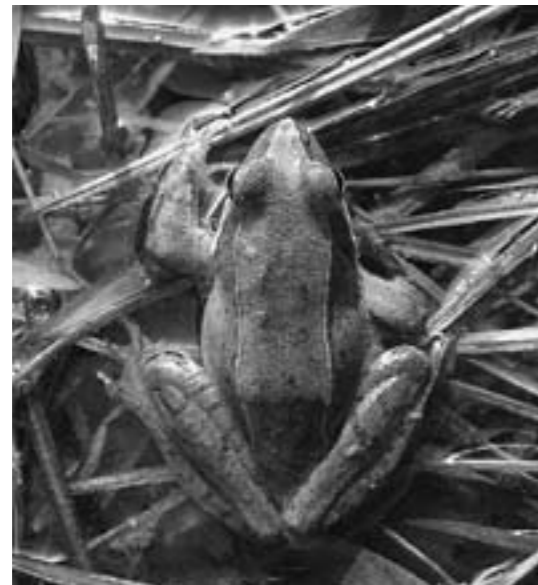
▲背中には2本の線模様があります(写真2)

なぜこの寒い季節に卵を産むのでしょうか? それにはヘビや水生昆虫などニホンアカガエルの成体やオタマジャクシの天敵となる生物がまだこの時期には活動していないこと、ほかのカエルのオタマジャクシとエサをめぐる争いが起こらないこと、などの理由があるようです。もともとアカガエルの仲間は北方起源であることから寒さには強いこと、そしてアカガエルを取り巻くさまざまな生き物との関係の中で