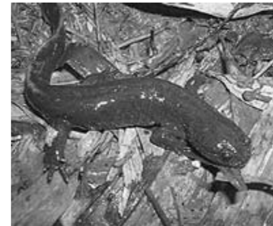
▲カスミサンショウウオの生体

もし、写真のような生き物や卵を見たことがある、という方がいらっしゃいましたら、ぜひ博物館までご連絡ください!!