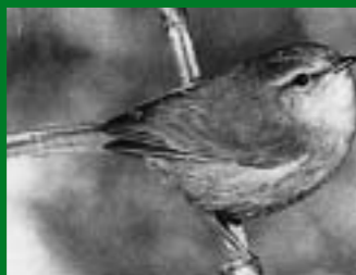
ウグイス [Cettia diphone]