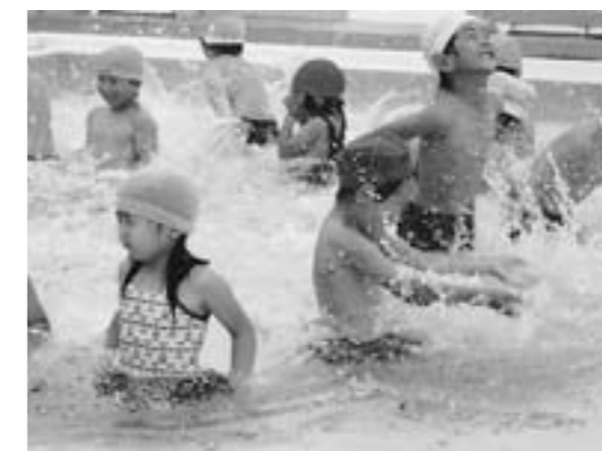
▲水かけっこ よーいどん

園でのプールあそびはもちろん、B&Gプールへ出かけるのを毎回楽しみにしていました。6月に行った時は冷たく感じたプールの水も、7月は温かく心地よく感じるほどでした。休憩時間に、ベブリースイミング教室で大きなプールに入っている赤ちゃんをじっと見て、「すごいことしてやるなあ」と感じていた子どももいたようです。そこで、教室で使われていた大きな滑り台をお借りして、みんなも大きなプールにチャレンジしました。ちょっぴり怖いような、でも少し得意げな顔も見せてくれました。