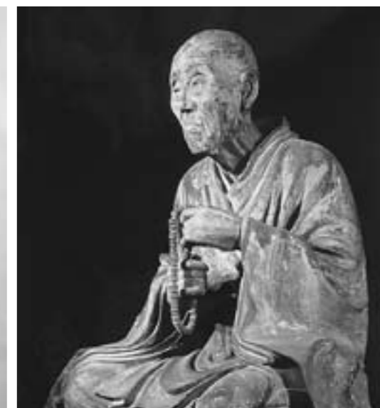
▲国宝 重源上人坐像(奈良国立博物館所蔵)※写真展示のみ