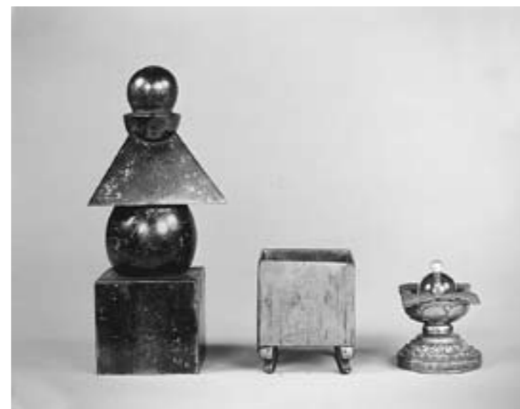
▲重要文化財 金銅製五輪塔(胡宮神社所蔵)

財もあわせて紹介します。 胡宮神社所蔵の金銅製五輪塔(重要文化財)が京都国立博物館から多賀町に里帰りします。この機会にぜひご覧ください。 期間■9月21日(日)~10月19日(日) 場所■あけぼのパーク多賀 ギャラリー、美術工芸展示室