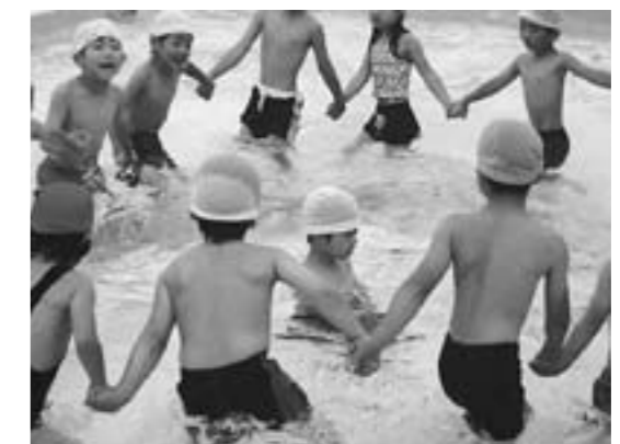
▲かごめかごめうしろのしょうめんだ〜れ

また、楽しいプールあそびをする中で、脱いだ服の片づけやプールから上がってからの身じたくができるようになったり、笛の合図ですぐに上がって整列すること、ルールをきちんと守らないと生命にかかわる危険が伴うことなど、約束をしっかり守って楽しく遊ぶことも学んでくれたみんなです。