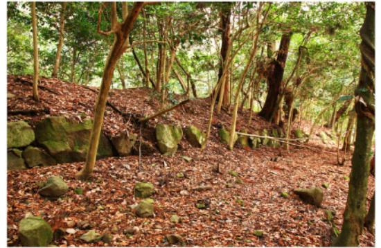
大沼報告 樞を石で固めた百済寺の土塁