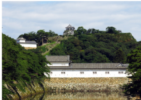
山上に建つ彦根城天守