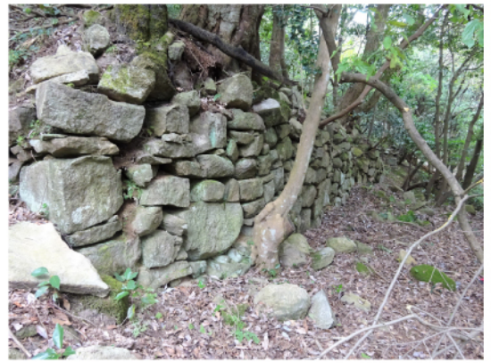
小林報告 長法寺石垣