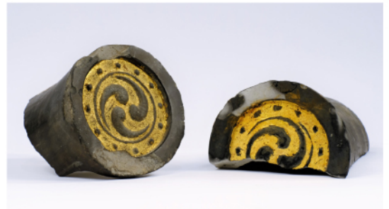
山下報告 安土城跡出土金箔瓦 滋賀県教育委員会・東近江市教育委員会