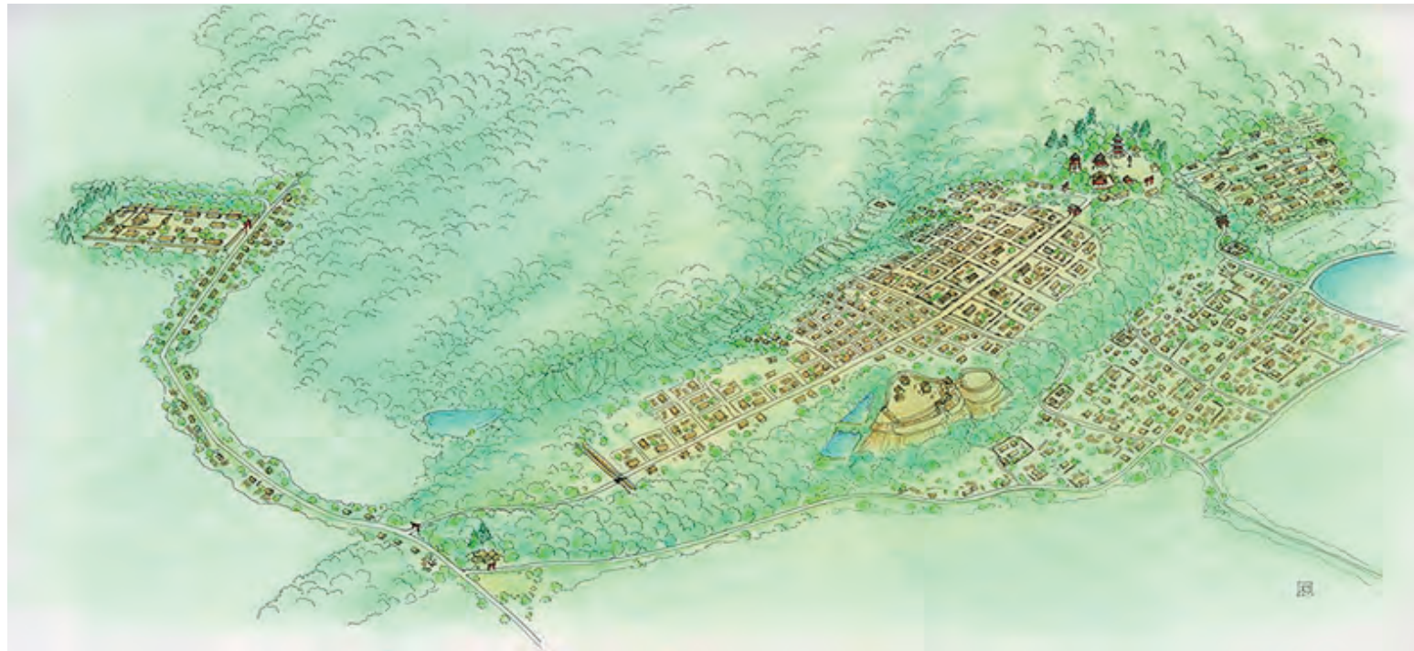
最盛期敏満寺推定復元イラスト 考証:仁木宏、音田直記、大高康正 イラスト:早川和子