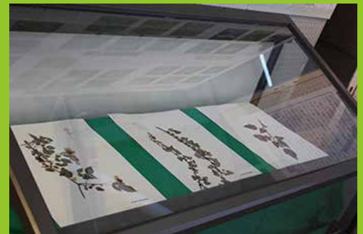
10年目をむかえた多賀の花の観察会