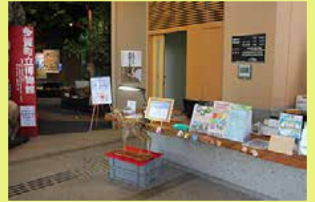
▲あけぼのパーク多賀の5月のようす▲