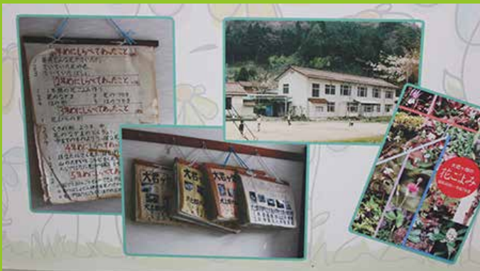
「大君ヶ畑の花ごよみ」のコーナー