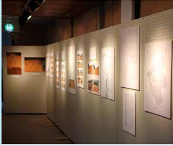
美術工芸展示室入口