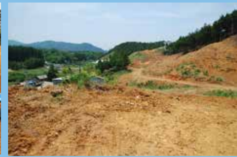
南側 富之尾方面へ