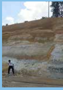
古琵琶湖層群のかべ