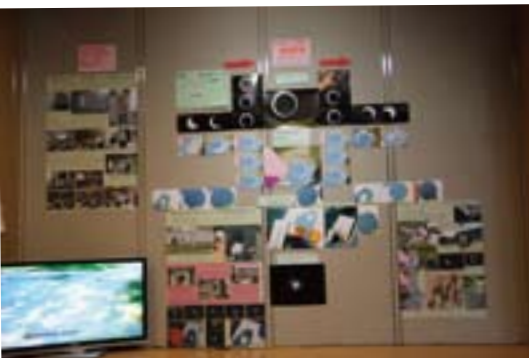
あけぼのパークでの観測