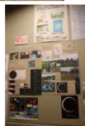
京都賀茂川プロジェクト

金環日食も金星の日面経過も、 好天で観測できたので、 あけぼのパーク多賀や、多賀 町の小学校、米原市の小学 校や米原高校の限界線観測、 県内の高校での観測、京都賀茂川