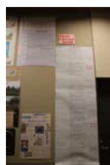
大滝小学校の観測