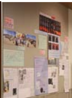
限界線 観測: 米原市の の学校